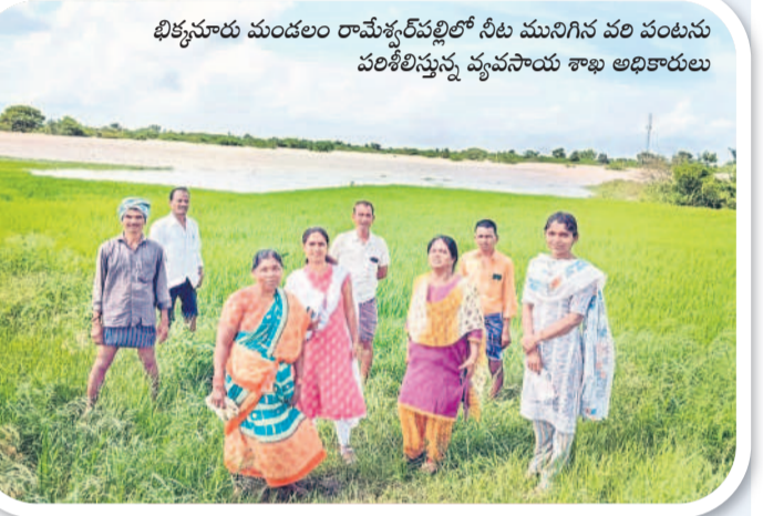
భిక్కనూరు మండలం రామేశ్వరపల్లిలో నీటి మునిగిన వరి పంటను పరిశీలిస్తున్న వ్యవసాయ శాఖ అధికారులు

ప్రభుత్వ పరిహారంపై ఆశలు పెట్టుకున్న రైతులు నిజామాబాద్, సెప్టెంబర్ 5 (నమస్తే తెలంగాణ ప్రతినీడి) : భారీ నుంచి అతి భారీ వర్షాలు కురియడంతో నిజామాబాద్, కామారెడ్డి జిల్లాలు తడిసి ముద్దయ్యాయి. కుండపోత వానలతో రైతాంగం కుదేలైంది. కొద్ది రోజుల్లో పంట చేతికి రానున్న తరుణంలో దంచికొట్టిన వర్షాల రైతులకు శాపంగా మారాయి. వరద పోట్లతో వేలాది ఎకరాలు నీటి మునిగాయి. పంట పొలాల్లో ఇసుక మేటలు వేశాయి. వరి, మక్కువోన్న పత్తి, సోయా తదితర పంటలకు తీవ్ర నష్టం వాటిల్లింది. నాలుగైదు రోజుల నుంచి కురిసిన వర్షాలు గురువారం కాస్త తెరిచినాయి. అయితే, వానలు, వడలతో ఎంత నష్టం జరిగిందనే లెక్క తేల్చడంలో అధికార యంత్రాంగం నిర్లక్ష్యం వహించినట్లు కనిపిస్తున్నది. క్షేత్ర స్థాయిలో జరిగిన వాస్తవ నష్టం లెక్క తేల్చాలని రైతులు డిమాండ్ చేస్తున్నారు. ఎందుకంటే ఇటీవల ఖమ్మం, మహబూబాబాద్ వరద ప్రభావిత ప్రాంతాల పర్యటనకు వెళ్లిన సీఎం రేవంత్ రైతులను నష్టపోయిన రైతులకు పరిహారం చెల్లిస్తామని ప్రకటించారు. ఈ నేపథ్యంలో ఉమ్మడి నిజామాబాద్ జిల్లాలోనూ భారీగా పంట పొలాలు దెబ్బతిన్న తరుణంలో.. ప్రభుత్వం నుంచి సాయం అందుతుందనే ఆశతో రైతులు ఎదురు చూస్తున్నారు. కానీ, వ్యవసాయ అధికారులు ఇంకా క్షేత్ర స్థాయి పర్యటనకు రాకపోవడంపై ఆందోళన చెందుతున్నారు.