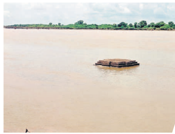
కందకర్తి వద్ద నదిలో బయటపడిన పురాతన శివాలయ శిఖరం