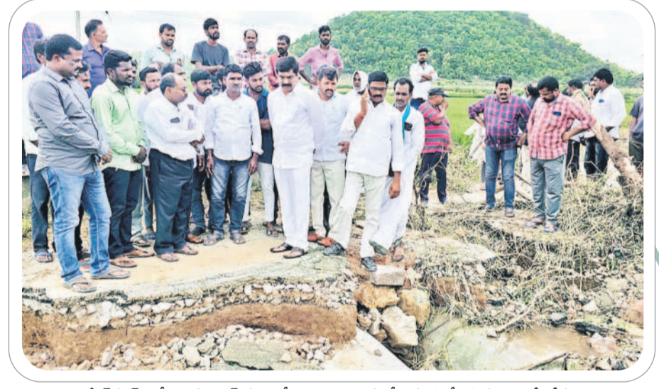
అమీర్ నగర్ - కోనాసముందర్ మధ్యలో కొట్టుకుపోయిన రోడ్డును పరిశీలిస్తున్న ఎమ్మెల్యే వేముల