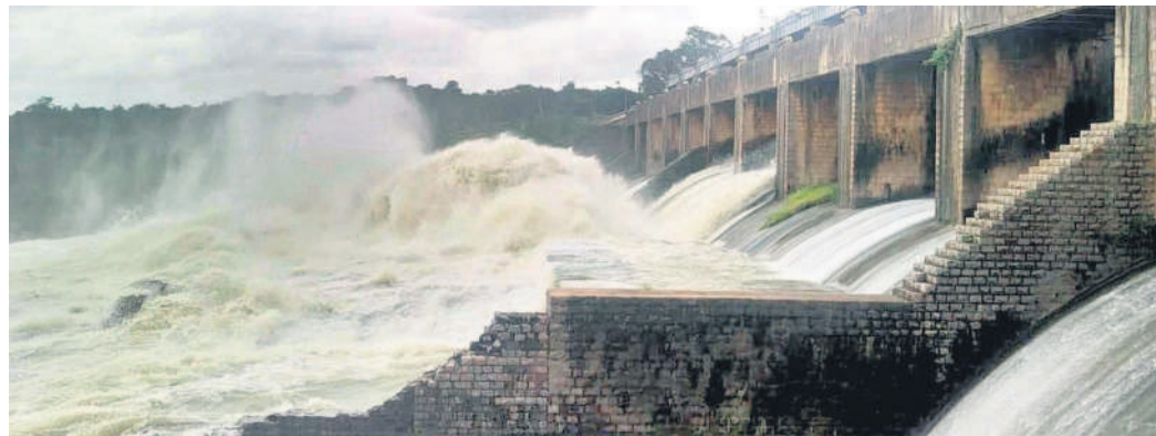
నిజాంసాగర్ ప్రాజెక్టు మూడు గేట్లు ఎత్తివేతతో దిగువకు వెళ్తున్న మిగులు జలాలు