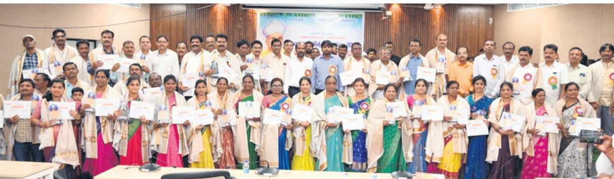
ఉపాధ్యాయులను సన్మానిస్తున్న మంచీర్యాల కలెక్టర్ కుమార్ దీపక్

విలేజ్ కలల సమావేశంలో సీఎం రేవంత్ రెడ్డికి రాసిన లేఖను చూపిస్తున్న మంచీర్యాల మాజీ ఎమ్మెల్యే దివాకర్ రావు