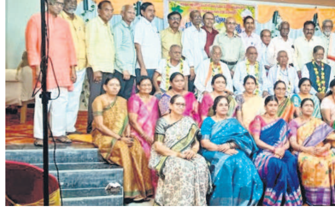
గురువులతో 1970-71 సంవత్సరం వందో తరగతి విద్యార్థులు