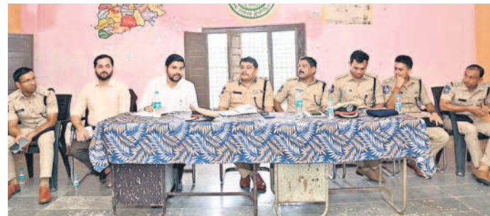
కుటుంబం ఆసిఫాబాద్ జిల్లాలోని జైనూర్లో మాట్లాడుతున్న అధికారులు