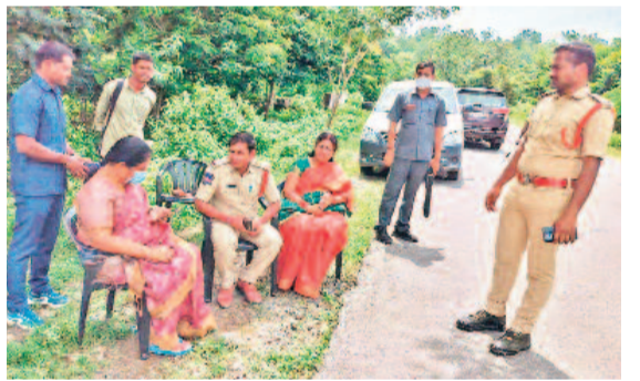
కుష్టం లోని జిల్లా కేంద్రం పోలీస్ స్టేషన్ లో పట్టుకున్న పోలీసులు