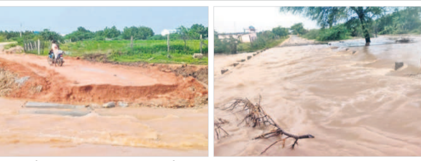
పోలోని వాగుపై ఏర్పాటుచేసిన డైవర్షన్ రోడ్డు కొట్టుకుపోయిన దృశ్యం, పొంగిపొరుతున్న జూలేతల్ వాగు