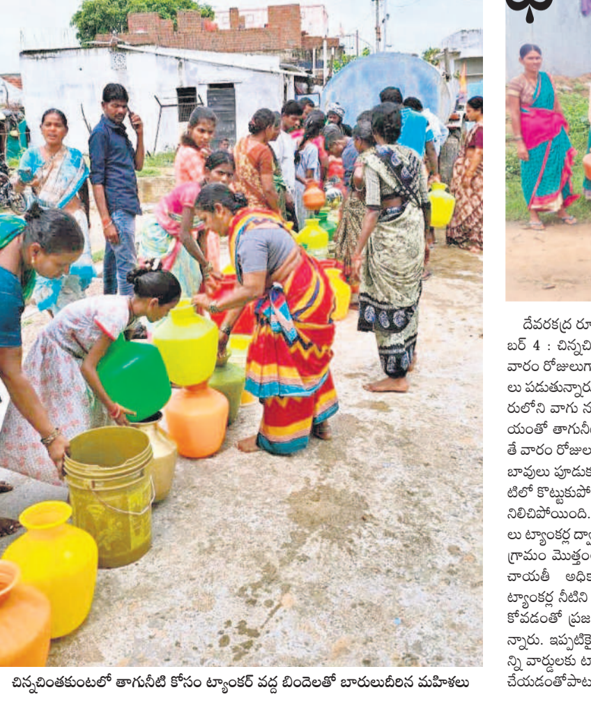
చిన్నచింతకుంటలో తాగునీటి కోసం ట్యాంకర్ వద్ద బిందెలతో బారులుదీరిన మహిళలు

చిన్నచింతకుంటలో వారం రోజులుగా తాగునీటికి కటకట • మల్లకల్ మండలం పెద్దతండాలోనూ ఇదే దుస్థితి • సమస్య చెబుదామంటే జీపీ కార్యాలయానికి తాళం • ఇబ్బందులు పడుతున్న ప్రజలు, పట్టించుకోని అధికారులు చిన్నచింతకుంటలో తాగునీటి కోసం ట్యాంకర్ వద్ద బిందెలతో బారులుదీరిన మహిళలు చిన్నచింతకుంటలో తాగునీటి కోసం ట్యాంకర్ వద్ద బిందెలతో బారులుదీరిన మహిళలు