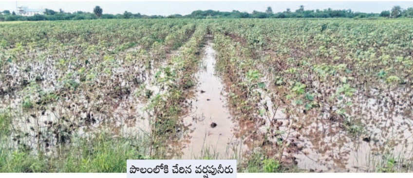
పాలాలోకి చేసిన వర్షపునీరు