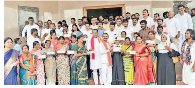
శామీర్పేటలో కల్యాణలక్ష్మి, షాబీముబారక్ చెక్కులను అందజేస్తున్న ఎమ్మెల్యే చామకూర మల్లారెడ్డి, ఎంపీ ఈటల రాజేందర్

కేసర, సెప్టెంబర్ 4: అర్హులదరికీ కల్యాణలక్ష్మి , షాదీముబారక్ పథకం కింద ఆర్థిక సాయం అం దిస్తున్నామని మేడ్చల్ ఎమ్మెల్యే చామకూర మల్లా రెడ్డి, ఎంపీ ఈటల రాజేందర్అన్నారు.కీసర మండ ల పరిషత్ కార్యాలయం వద్ద బుధవారం 40 మం ది లబ్దిదారులకు కల్యాణలక్ష్మి,షాదీముబారక్ పథ కం కింద ఒక్కోక్కరికి రూ. 1.16లక్షల రూపాయ ల చొప్పున చెక్కులను లబ్దిదారులకు పంపిణీ చేశా రు. ఈ సందర్భంగా ఎమ్మేల్యే మల్లారెడ్డి, ఎంపీ ఈటల రాజేందర్ మాట్లాడుతూ తెలంగాణ ప్రభు