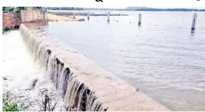
ఘట్కేసర్,సెప్టెంబర్4: మూడు రోజులు పాటు ఎడతెరిపి లేకుండా కురిసిన వర్సాలకు మండలంలోని ఏదులాబాద్లోని లక్ష్మీనారాయణ చెరువు అలుగు పారుతుంది. దీంతో గ్రామ స్థులు,రైతులు,మత్స్యకారులు హర్షం వ్యక్తం చేస్తున్నారు. చెరువు నీరు అలుగు దూకడంతో ఇతర ప్రాంతాల నుంచి వచ్చి చెరువు నీటిని చూసి ఆనందం వ్యక్తం చేస్తున్నారు.