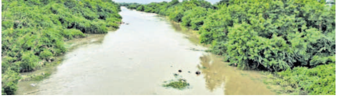
సంగారెడ్డి మండలంలో ఉధృతంగా ప్రవహిస్తున్న నక్కల వాగు