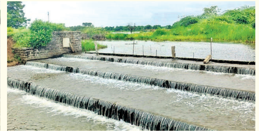
మత్తడి దుంకుతున్న సిద్దిపేట జిల్లా కోనాడ మండలంలోని శనిగండ్ల ప్రాజెక్టు