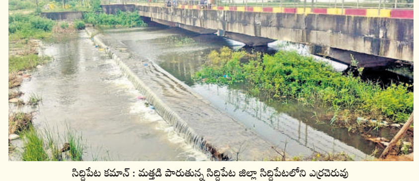
సిద్దిపేట కమాన్ : మత్తడి పారుతున్న సిద్దిపేట జిల్లా సిద్దిపేటలోని ఎర్రచెరువు

సిద్దిపేట, సెప్టెంబర్ 3: బంగాళాఖాతంలో ఏర్పడిన వాయుగుండ ప్రభావం వల్ల సిద్దిపేట జిల్లా వ్యాప్తంగా మోస్తరు వర్షం కురిసింది. మంగళవారం ఉదయం వర్షం తెరిపి ఇచ్చింది. మధ్యాహ్నం తర్వాత చిరుజల్లులతో కూడిన వర్షంతోపాటు అక్కడక్కడ మోస్తరు వర్షం పడింది. నాలుగు రోజులుగా కురుస్తున్న వర్షాలకు చెరువులు, కుంటలు, చెట్ల్యామ్లులు మత్తడి దుంకుతున్నాయి. వర్షం ప్రభావంతో జిల్లాలోని పలు గ్రామాల్లో శిథిలావస్థలో ఉన్న ఇండ్లు కూలిపోయాయి. గజ్వేల్ మండలం అక్కారంలోని కోనాపూర్ చెరువును కల్వేర్ల మనుచౌదరి సందర్భించారు. వాగులు, వంకలు ప్రమాదకరంగా ప్రవహిస్తున్న దృశ్యాలు మత్తడికారులు చేపల వేటకు వెళ్లకండా చూడాలని ఆయన అధికారులకు సూచించారు. జిల్లా వ్యాప్తంగా 1.3 సె.మీ వర్షపాతం నమోదైంది. అత్యధికంగా కురుమారుపల్లిలో 3.62 సె.మీ, అత్యల్పంగా నారాయణరావుపేట మండలంలో 0.16 సె.మీ వర్షం పడింది.