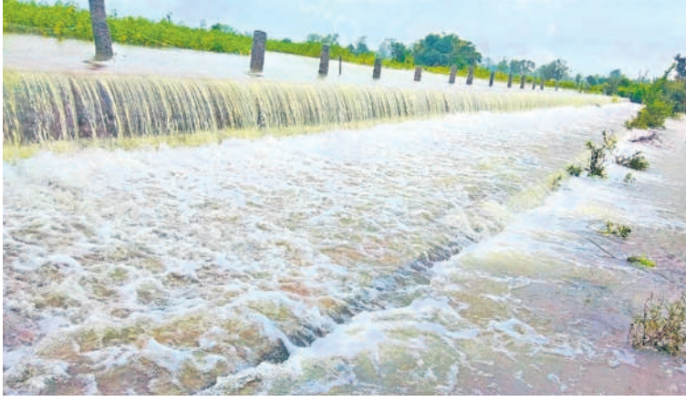
మెదక్ జిల్లా వెల్దుర్తి మండలంలో అలుగు పారుతున్న అందుగులపల్లి పెద్దచెరువు