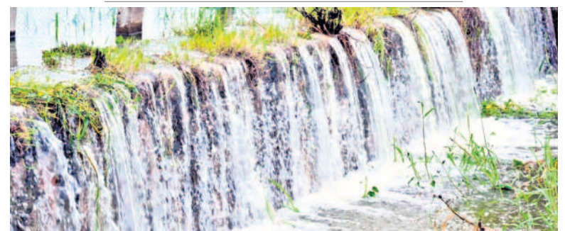
సంగారెడ్డి మండలం చివ్వూరులో మత్తడి దుంకుతున్న చెరువు