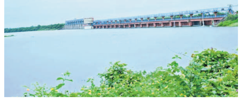
సంగారెడ్డి జిల్లా కల్వగూర్ మండలా ద్యామలోకి వచ్చిన భారీ వరద

పుల్వల్, సెప్టెంబర్ 3: సంగారెడ్డి జిల్లా పుల్వల్ మండలంలోని బాగారెడ్డి సింగూరు ప్రాజెక్టుకు వరద కొనసాగుతోంది. మంగళవారం ఉదయం ఆరు గంటల వరకు 24.301 క్యూసెక్కుల నీరు రాగా సాయంత్రం ఆరుగంటల వరకు సుమారు 10.10 క్యూసెక్కుల నీరు వచ్చినట్లు ప్రాజెక్టు అధికారులు తెలిపారు. వరద తీవ్రత 33,920 క్యూసెక్కుల వస్తున్న వల్ల కారణంగా అధికారులు ప్రాజెక్టు వద్ద