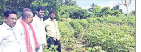
తాంసి: పత్తి పంటలను పరిశీలిస్తున్న బోధ్ ఎమ్మెల్యే జాడవ్ అనిల్

ఇంద్రవెల్లి, సెప్టెంబర్ 3 : భారీ వర్షాల నేపథ్యంలో మండల అధికారులు అప్రమత్తంగా ఉండాలని డిజిఆర్‌వో నాయర్ అన్నారు. మంగళవారం మండలంలోని వడగాడ, ముర్గానూడ, లాల్‌బేడక, అంజి గ్రామాలను సందర్శించారు. కోతకు గురైన వాటిని పరిశీలించారు. వరద ప్రపంపాపై అధికారులను అడిగి తెలుసుకున్నారు. ఈ సందర్భంగా ఆయన మాట్లాడుతూ కోతకు గురైన రోడ్లు, ఆస్కర్లకు వెంటనే మరమ్మతులు చేసి ప్రజల రాకపోకలకు ఇబ్బంది లేకుండా చర్యలు తీసుకోవాలన్నారు. కార్యక్రమంలో గ్రామ పంచాయతీ అధికారులు తదితరులు పాల్గొన్నారు. నార్యూర్, సెప్టెంబర్ 3 : నార్యూర్, గాదిగూడ మండలాల్లో