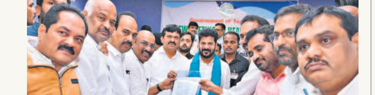
సీఎం రేపంపేటి విల్ల రజాజీయాల అధికార పతనం అందజేస్తూ ఉద్యోగ జేపీసీ సభ్యులు నేతలు

హైదరాబాద్, సెప్టెంబర్ 3 (నమస్తే తెలంగాణ): రాష్ట్రంలోని వరద బాధితులకు రాష్ట్ర ప్రభుత్వం ఉద్యోగుల బాసటగా నిలిచింది. ఒకరోజు మూల వేతనాన్ని విరాళంగా ఇస్తూ మున్సిపాలిటీలకు జేపీసీ సభ్యులు మంగళవారం ప్రకటించారు. హైదరాబాద్ నాంద్యాలలోని టీఎస్ఎఫ్ భవన్ లో ఎంపీయూసీ జేపీసీ నేతలు అత్యవసరం వరద బాధితుల సాయంపై చర్చించారు. 205 సంఘాలతో కూడిన జేపీసీ సభ్యులు రూ.130 కోట్లను కేటానిన జేపీసీ నేతలు అక్కడి జిల్లా కలెక్టర్ కేసీ సీఎం రేపంపేటి కలిసి తమ అంగీకారంతో అందజేశారు. రాష్ట్రంలోని గిడిడి అధికారులు, ఉపాధ్యాయులు, కార్మికులు విన్నవించి, కొంట్రాక్ట్, బెటర్ సార్వీస్, కమిటీ సమావేశం, మహిళాబాలబడిలో సీఎంల అధికార పతనం అందజేత, సెప్టెంబర్ నెల వేతనం నుంచి జమ చేయాలని విసతి