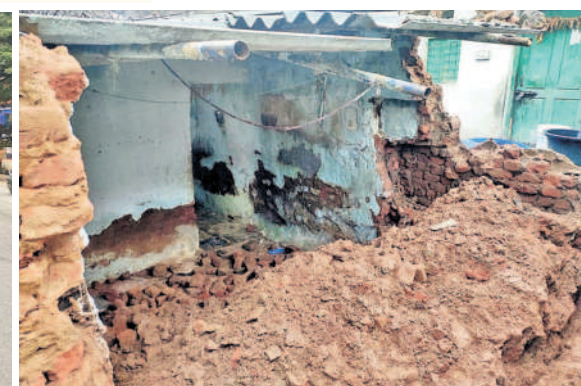
దుండిగల్లో కూలిన బాలమణి రేకుల ఇల్లు

కలిసి వినతి పుతం అందజేశారు. ఈ సంద ర్బంగా వారు మాట్లాడుతూ ఎస్ఆర్ నాయక్ నగర్, జీడిమెట్ల పారిశ్రామిక వాడ కు సంబం ధించిన లారీలు, ట్రుక్కులు ఎక్కడపడితే అక్కడ పార్క్ చేయడంతో పలువురు ప్రమా దాల భారిన పడుతున్నారని, అలాగే ట్రాఫిక్ సమస్య ఏర్పడుతుందని ఆయన దృష్టికి తీసు