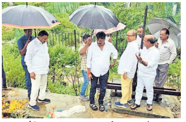
అంబీర్ చెరువు అలుగు ప్రాంతాన్ని పరిశీరిస్తున్న ఎమ్మెల్యే గాంధీ