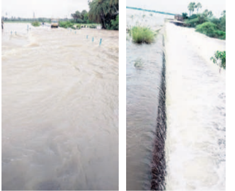
నర్సంపేట రూరల్: గురిజాల నర్సంపేట రూరల్: మత్తడిపోయిన కాజీపేట పైనుంచి పారుతున్న వరద మాధవపేట పెద్ద చెరువు