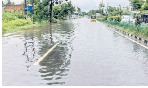
కరీమాబాద్: ఖమ్మం రోడ్డులో పారుతున్న వాన నీరు