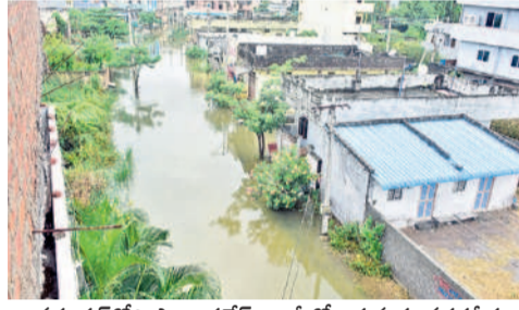
వరంగల్లోని సాయిగణేశ్ కాలనీలో ఇళ్ల మధ్య వరదనీరు