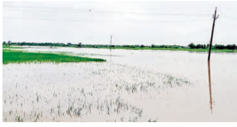
చెన్నారావుపేట: నీటి మునిగిన పొలాలు