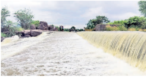
నంగెం: మత్తడిపడుతున్న నంగెం చెరువు