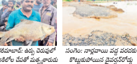
కరీమాబాద్: ఉర్లు చెరువులో 15 కిలోల మేవతో మత్స్యకారుడు