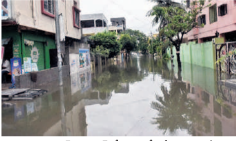
భీలావరంగల్: శివనగర్లో ఇండ్లలోకి చేరిన వరద నీరు

అలుగుపోయిన చెరువులు ఖానాపురం మండలం పాకాల సర్కస్ ఈ ఏడాది మరోసారి అలుగుపోయింది. జిల్లాలో 816 చెరువులు ఉండగా వీటిలో 408 నిండి అలుగు పోయినట్లు నీటిపారుదల శాఖ అధికారులు వెల్లడించారు. 353 చెరువుల్లోకి 75 నుంచి 100 శాతం, 39 చెరువుల్లోకి 50 నుంచి 75 శాతం, 3 చెరువుల్లోకి 25 శాతం నీరు చేరిందని సమాచారం అందినట్లు తెలిపారు. వరద ఉధృతమై చెన్నారావుపేట మండలం అమీనాబాద్, కోనాపురంలోని నాలుగు చెరువులకు, నెక్కొండ మండలం కేంద్రంలోని పెద్దచెరువు, రాయపల్లి మండలం కేంద్రంలోని రామచంద్రుడిచెరువు మత్తడి వద్ద, వర్దన్నపేట మునిసిపాలిటీ పరిధిలోని కొనారెడ్డి చెరువుకు బుంబులు పడినట్లు అధికారులు దృష్టికి వచ్చింది.