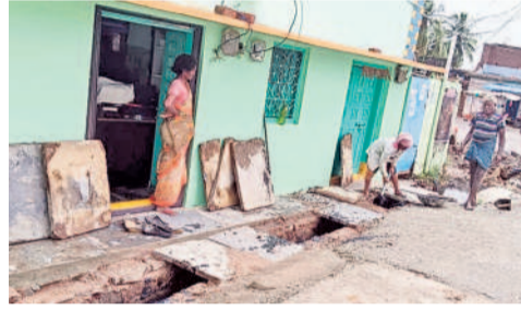
చెన్నారావుపేట: మురుగుకాలువలు శుభ్రం చేసుకుంటున్న గ్రామస్థులు