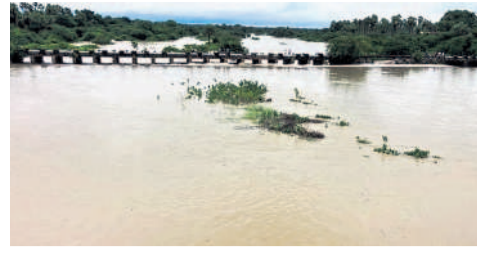
వర్దన్నపేట: ఉధృతంగా ప్రవహిస్తున్న ఆకరువారు