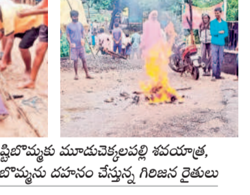
ఎమ్మెల్యే దొంగి దిప్పబోయిన మూడుచెక్కలపల్లి శవయాత్ర, కొండాపూర్లో దిప్పబోయిన దహనం చేస్తున్న గిరిజన రైతులు

● బాధితుల గ్రామాల రైతుల ఆవేదన ● మూడు గ్రామాల్లో డాంబి దిప్పబోయి దహనం నల్లబెట్టి, సెప్టెంబర్ 1: ఎమ్మెల్యే దొంగి మాధవరెడ్డి రంగాయచెరువు ప్రాజెక్ట్ పేరుతో రిడిగ్నింగ్ కుట్ర చేస్తున్నారని మండలంలోని ఏజెన్సీ గ్రామాల గిరిజన రైతులు ఆరోపిస్తున్నారు. ఇటీవల జరిగిన చొక్కారావు దేవాలయ ప్రాజెక్ట్ సమీక్ష సమావేశంలో ఒక టీఎంసీ నీటి సాను ర్షంతో నిర్బంధించుకు రంగాయచెరువు ప్రాజెక్టు రేవంత్ సర్కార్ అనుమతులు ఇచ్చి పాత ఎలివేషన్ ప్రకారం నిరులు మంజూరు చేయాలని ఎమ్మెల్యే దొంగి లేవనెత్తారు. ప్రాజెక్ట్ పేరుతో గిరిజన రైతుల ఆభ్యున్నతికి వ్యతిరేకంగా చేపట్టడంపై మండలంలోని ఏజెన్సీ గ్రామాల రైతులు నిరసనలు తెలుపుతున్నారు. తాళా గ్రామాల మండలంలోని మూడుచెక్కలపల్లి, కొండాపూర్, ఎల్లెమ్మలపల్లి గిరిజన రైతులు దొంగి దిప్పబోయినట్లు ఆరోపిస్తున్నారు. రంగాయచెరువు ప్రాజెక్ట్ నిర్మాణ ప్రక్రియను తాము ఇప్పుడు అడ్డుకుంటామని తెలిపారు. ఇప్పటికైనా ఎమ్మెల్యే ఈ నిర్ణయాన్ని విరమించుకోవాలని, లేదంటే బొమ్మలను ఆదివారం శవయాత్రలు నిర్వహించి దహనం చేశారు. ఈ సందర్భంగా వారు మాట్లాడుతూ తాము తాల నుంచి పోతున్న జీవంతులను తమకు అండగా ఉండాలని ఎమ్మెల్యే దొంగి గతంలోనే రంగాయచెరువు-ఎల్లెమ్మలపల్లి ప్రాజెక్ట్ నిర్వహించేటప్పుడు గ్రామాలను ముంచుకున్నారని రైతులు ఆవేదన వ్యక్తం చేశారు. రంగాయచెరువు రిజర్వాయర్ ప్రాజెక్ట్ నిర్మాణ ప్రక్రియను తాము ఇప్పుడు అడ్డుకుంటామని తెలిపారు. ఇప్పటికైనా ఎమ్మెల్యే ఈ నిర్ణయాన్ని విరమించుకోవాలని, లేదంటే తన గుణపాఠం చెబుతామని హెచ్చరించారు.