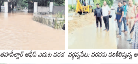
వర్దన్నపేట: తహసీల్దార్ ఆఫీస్ ఎదుట వరద