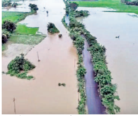
వర్దన్నపేట: కొత్తపల్లి శివారంలో నీటి మునిగిన పంట పొలాలు

జిల్లాలో శనివారం రాత్రి నుంచి ఆదివారం ఉదయం వరకు వాన దంచికొట్టింది. నర్సంపేట నుంచి నెక్కొండ, మహబూబాబాద్, కొత్తగూడెం వంటి ప్రధాన రూట్లలో రాకపోకలు స్తంభిల్చాయి. రాజన్న సిరిసిల్ల జిల్లా నుంచి మహబూబాబాద్ జిల్లా కేంద్రానికి ప్రయాణికులతో బయల్దేరిన ఆర్టీసీ బస్సు శనివారం రాత్రి 10 గంటలకు మార్దమర్డలోని నెక్కొండ మండలం వెంకటాపురం వద్ద రెండు లోలోపల్ కాజీపేట నడుమ విక్రమించింది. రెండు వైపులా బస్సు దాటి అవకాశం లేకపోవడంతో ఆదివారం ఉదయం ఆదికారులు ప్రత్యేకంగా ఒక లారీ ద్వారా బస్సులో ఉన్న 45 మంది ప్రయాణికులను సురక్షితంగా బయటకు తీసుకువచ్చారు. నెక్కొండలో బోజనం సమకాలిని ప్రత్యేక బస్సు ద్వారా వీరిని వరంగల్ నగ