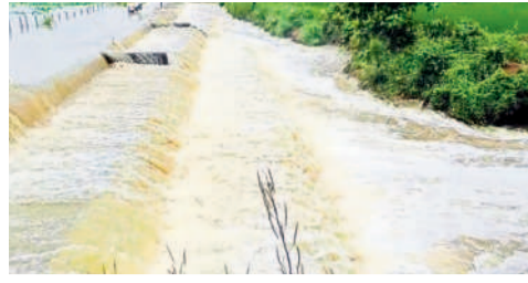
నెక్కొండ: మత్తడిపోయిన పొలాలలో ఊర చెరువు