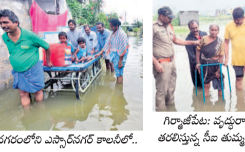
నగరంలోని ఎస్సార్ నగర్ కాలనీలో..