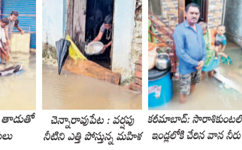
ఖీలావరంగల్: శివనగర్లో బైక్స్ తాడుతో బయటకు లాగుతున్న స్థానికులు