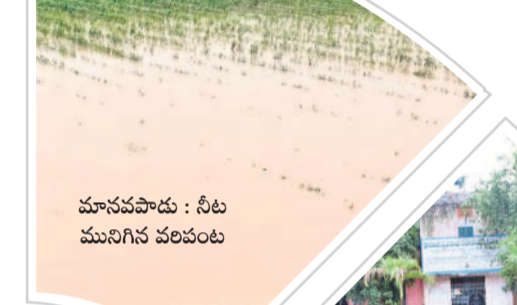
మానవపాదం : నీటి మునిగిన వరిపంట