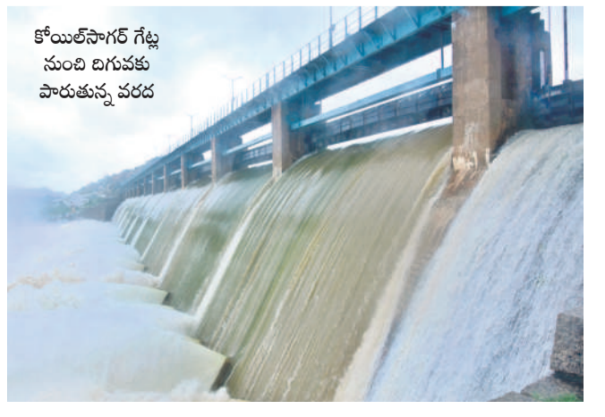
కోయిలసాగర్ గేట్లు నుంచి దిగువకు పారుతున్న వరద