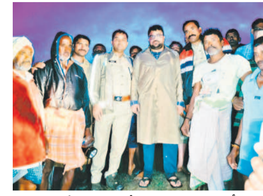
ఒడ్డుకు చేరిన కావలంతో నాగర్ కర్నూల్ కలెక్టర్, ఎస్పీ