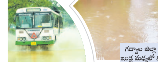
గద్యాల జిల్లా కేంద్రంలో ఇండ్లు మధ్యలో నిలిచిన నీరు