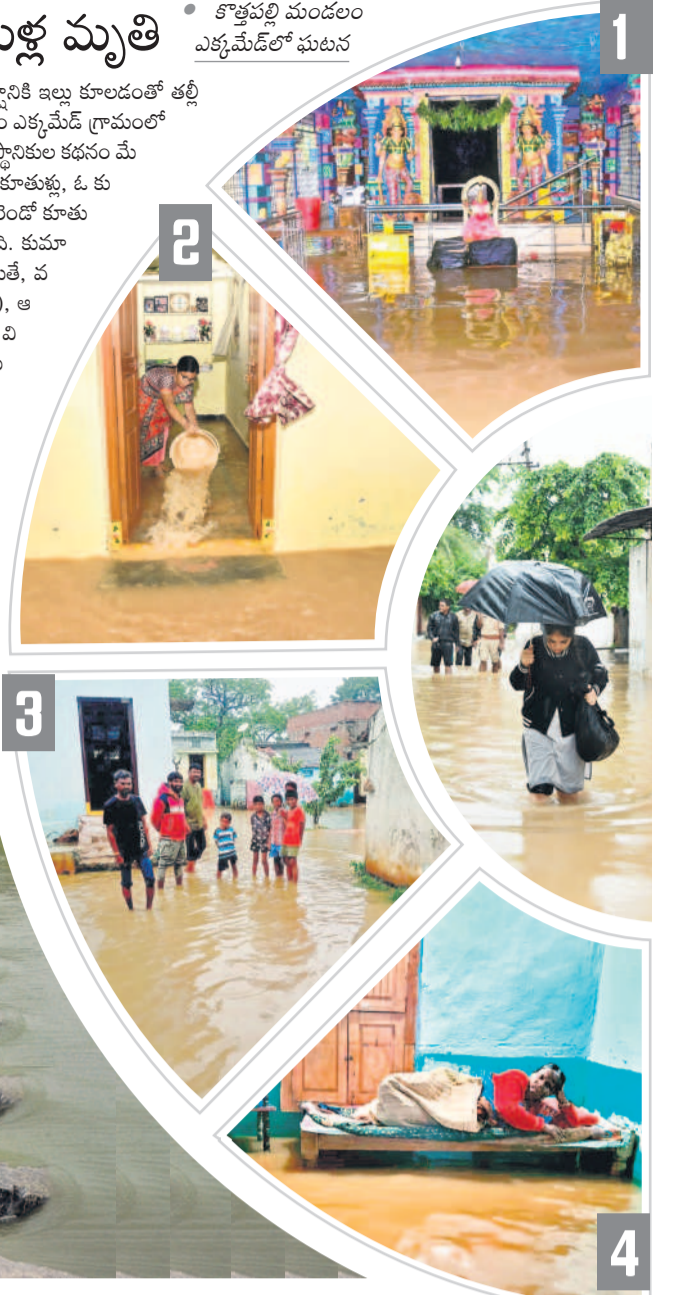
1. మహబూబ్ నగర్ జిల్లా కేంద్రంలోని రేణుకా ఎల్లమల్ల ఆలయ ప్రాంగణంలో భారీగా చేలన వర్షపు నీరు 2. మహబూబ్ నగర్ కులహినిశెట్టి కాలనీలో ఇంటిలోకి చేలన నీటిని తోడుతున్న మహిళ 3. నారాయణపేట జిల్లా ధన్వంతరీ మండల కేంద్రంలోని దశిశివవారి ఇంట్లోకి చేలన వర్షపు నీరు 4. మహబూబ్ నగర్ జిల్లా జడ్చర్ల పట్టణంలోని శివాజీనగర్ కాలనీలో ఇంట్లోకి చేలన నీటిలో చిక్కుకుంటూ చూస్తున్న వ్యధురాలు