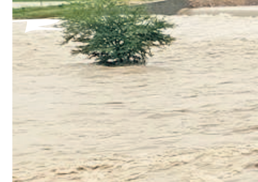
అత్తకూరు : అల్లిపూర్ వాగు బ్రిడ్జిపై పారుతున్న నీరు