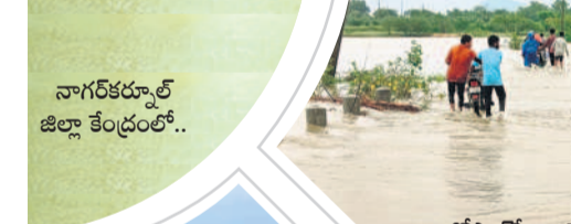
నాగర్ కర్నూల్ జిల్లా కేంద్రంలో..