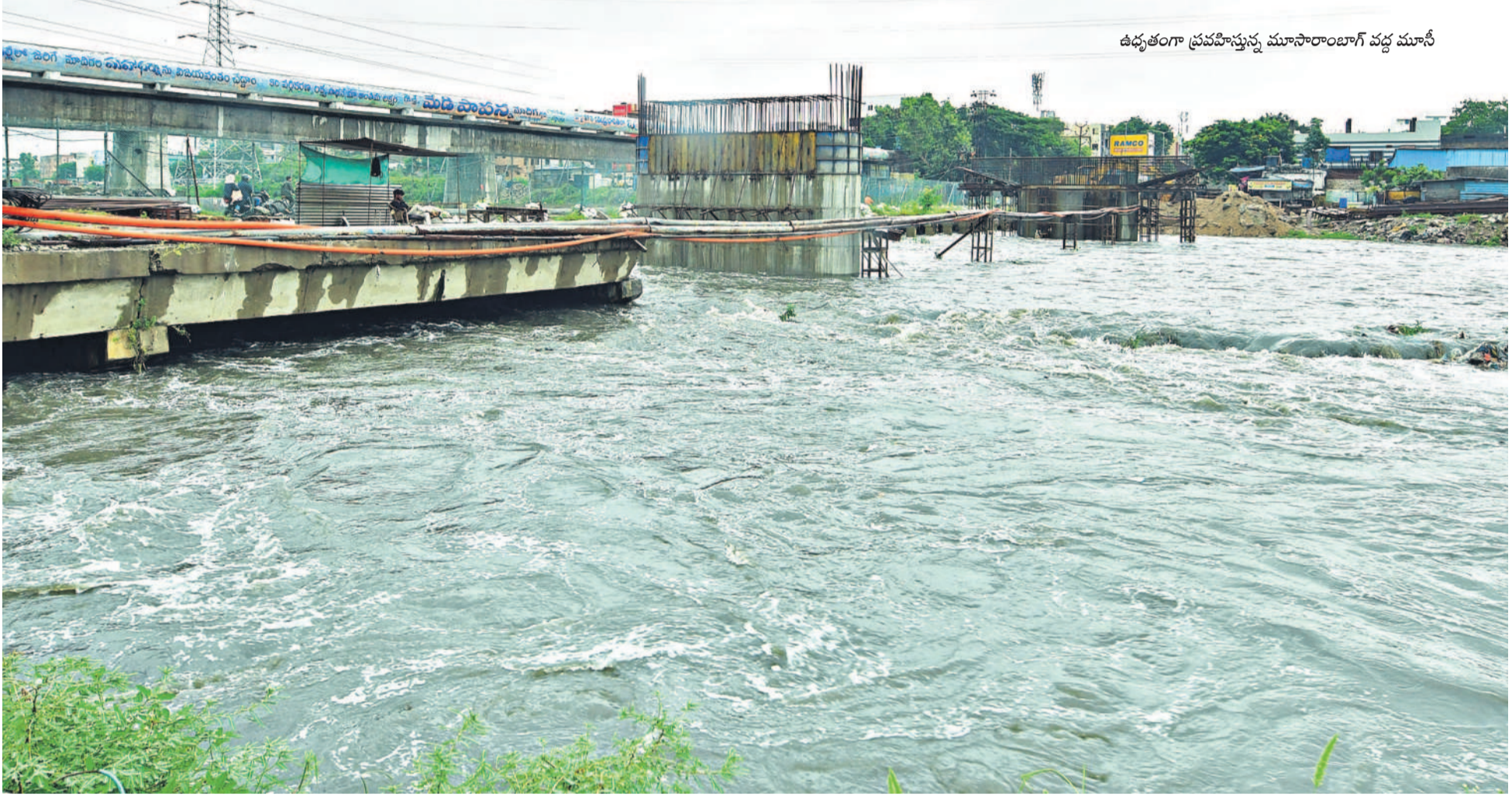
ఉధృతంగా ప్రవహిస్తున్న మూసారాంబాగ్ వద్ద మూసీ