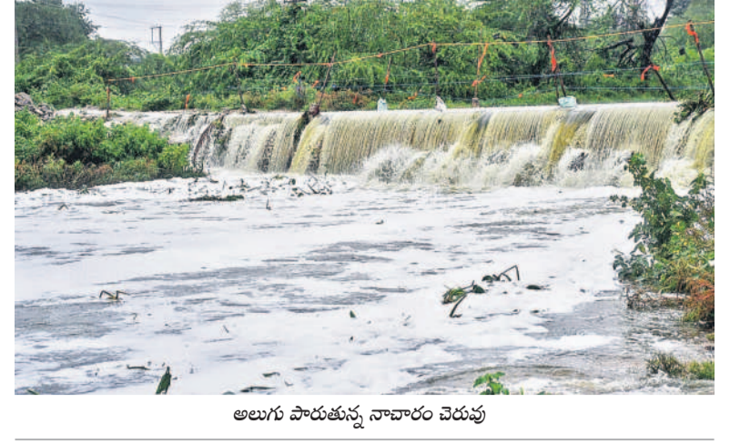
అలుగు పారుతున్న నాచారం చెరువు