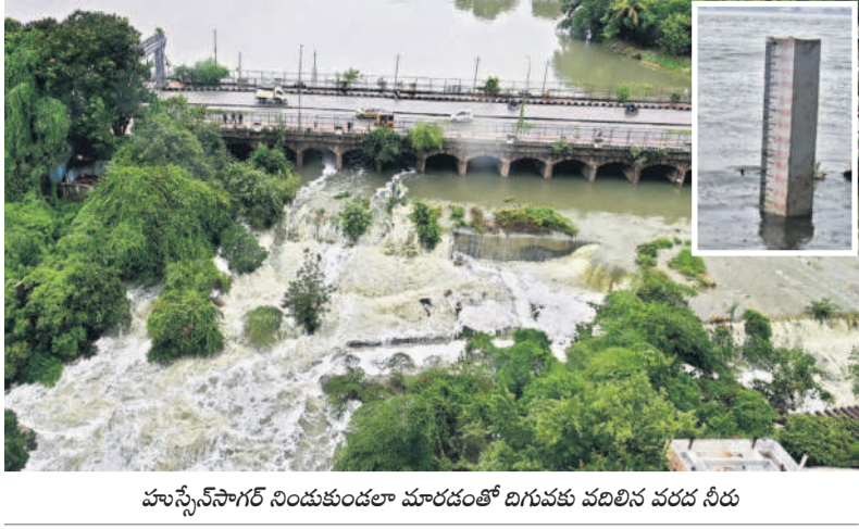
హుస్సేన్సాగర్ నిండుకుండలా మారడంతో దిగువకు వదిలిన వరద నీరు