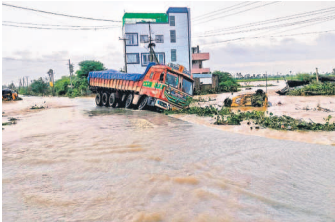
హుజూరనగర్ పట్టణంలో మరంపల్లి రోడ్డులో నీట వరద నీటిలో చిక్కుకున్న లాల్

సాగర్, మూసీ కాల్వలకు గండ్లు వరద పోటిత్తండంతో కోదాడ నియోజక వర్గ పరిధిలోని నడిగూడెం సమీపంలో నాగార్ ధ్వంస సాగర్ ఎడమ కాల్వకు గండ్ పడింది. దాంతో రామచంద్రాపురం గ్రామంలోకి నీళ్లు చేరడంతో జలదిగ్బంధంలో చిక్కుకుంది. పంటలు నీటమునిగాయి. ఇక సూర్యాపేట మండలం పిల్లలమర్రి సమీపంలో మూసీ ఎడమ కాల్వకు గండ్ పడింది. దీంతో పంట పొలాలు నీట మునిగాయి. మూసీ అధికారులు వెంటనే ఇసుక బస్తాలు వేసి గండ్ని పూడ్చారు. నాగార్ధ్వంససాగర్ ఎడమ కాల్వకు నీటి ప్రవాహం అధికంగా ఉండడంతో ఎన్ఎ