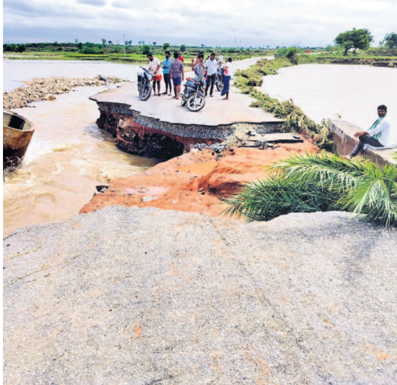
అదివారం సూర్యాపేట జిల్లా మరంపల్లి సమీపంలో తెగిన బీటీ రోడ్డు