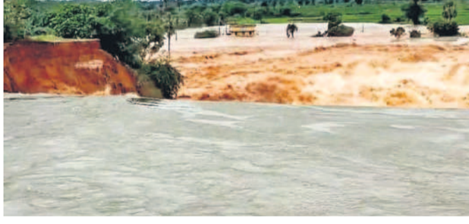
సూర్యాపేట జిల్లా నడిగూడెం మండలంలో సాగర్ ఎడమ కాల్వకు పడిన గండ్