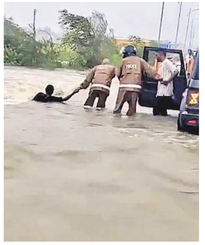
నాగర్ కర్నూల్ లోని నాగనూల్ వాగులో కొట్టుకుపోతున్న వ్యక్తిని కాపాడుతున్న పోలీసులు