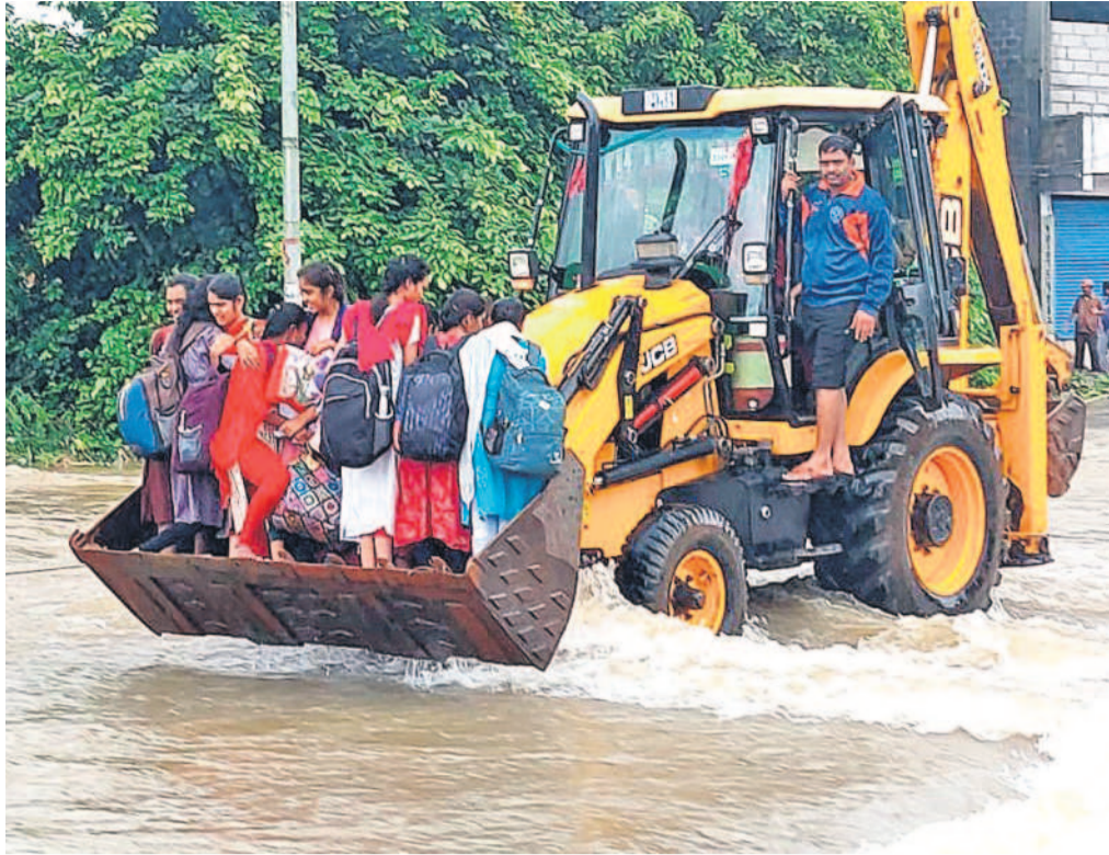
సూర్యాపేట జిల్లా కోదాడ పట్టణంలో వరదనీటిలో చిక్కుకున్న విద్యార్థులను జేసీబీ సాయంతో సురక్షిత ప్రాంతానికి తరలిస్తున్న సిబ్బంది