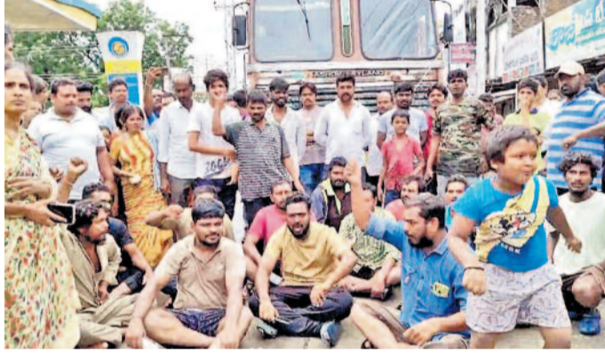
ఖమ్మంలో అదివారం రాస్తారోకో చేస్తున్న వరదముంపు బాధితులు.. సాయంత్రం పరామర్శకు వచ్చిన తుమ్మలను నిలబెట్టున్న ప్రజలు

రికార్డు వర్షాలతో అల్లకల్లోలం విరుచుకుపడిన వాన.. ముంచెత్తిన వరద.. రాష్ట్రమంతా అతలాకుతలం జల విలయంతో ఖమ్మం విలవిల.. సహాయ చర్యల్లో సర్కారు తాత్పారం