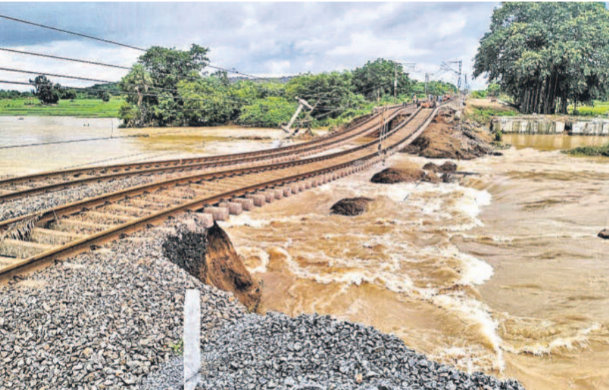
మహబూబాబాద్ జిల్లా కేసముద్రంలో వరద ఉధృతికి కొట్టుకుపోయిన రైల్వే ట్రాక్

భారీ వర్షాలకు రాష్ట్రం అతలాకుతలమైంది. జనజీవనం అస్తవ్యస్తమైంది. వాగులు, చెరువులు పొంగి పొద్దంతో ఊళ్లు, కాలనీలు నీటమునిగాయి. రోడ్లు కోతకు గురవగా, రైల్వే ట్రాకులు కొట్టుకుపోయాయి. రాష్ట్రమంతా వర్ష బీభత్సం నెలకొన్నా.. ఖమ్మం జిల్లా మాత్రం జలవిలయంతో విలవిలాదైంది. ఇండ్లపైకి ఎక్కి ప్రజలు సహాయం కోసం అర్థింపడం కనిపించింది. 2,500 మందిని సురక్షిత ప్రాంతాలకు తరలించినట్లు ప్రభుత్వం చెప్పు న్నప్పటికీ.. క్షేత్రస్థాయిలో సహాయ చర్యల తీవ్రత అంతగా కనిపించలేదు. సర్కారు వైఫల్యంపై పలువోట్ల ప్రజలు తీవ్ర స్థాయిలో విరుచుకుపడ్డారు. >2