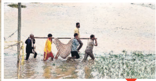
మహబూబాబాద్ జిల్లా నీలొలు మండలంలో ఓ వృద్ధురాలిని తరలిస్తున్న ధ్వజం