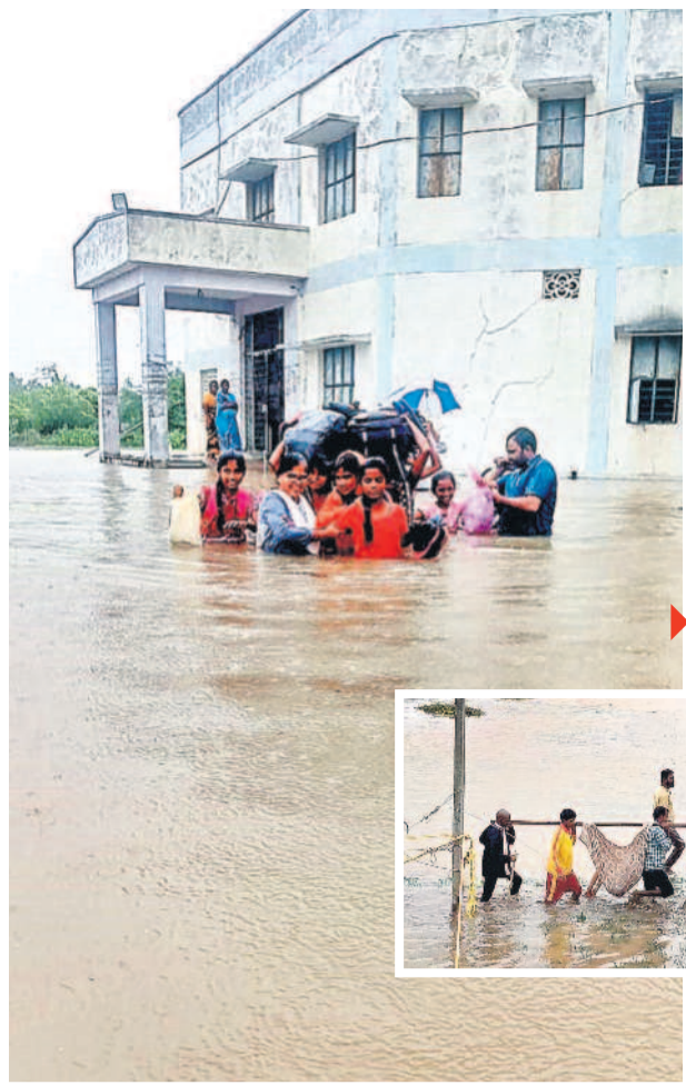
సూర్యాపేట జిల్లా లక్ష్మవల్లి కేజీడికి సుంచి విద్యార్థులను బయటికి తీసుకొస్తున్న అధికారులు

సోమవారం, సూర్యోదయం: 6-02, సూర్యాస్తమయం: 6-29. శ్రీ క్రోధి నామ సంవత్సరం దక్షిణాయనం వర్ష రుతువు శ్రావణ మాసం తిథి: అమావాస్య పూర్ణి. నక్షత్రం: మఖ రాశి 12-21 వరకు. వర్షం: ఉదయం 11-05 నుంచి పగలు 12-51 వరకు. రాహుకాలం: ఉదయం 7-86 నుంచి ఉదయం 9-09 వరకు. దుర్భుధారాం: పగలు 12-40 నుంచి పగలు 1-29 వరకు. పునర్ దుర్భుధారాం: పగలు 1-09 నుంచి పగలు 3-58 వరకు. అమృతకాలం: రాత్రి 9-40 నుంచి రాత్రి 11-27 వరకు.