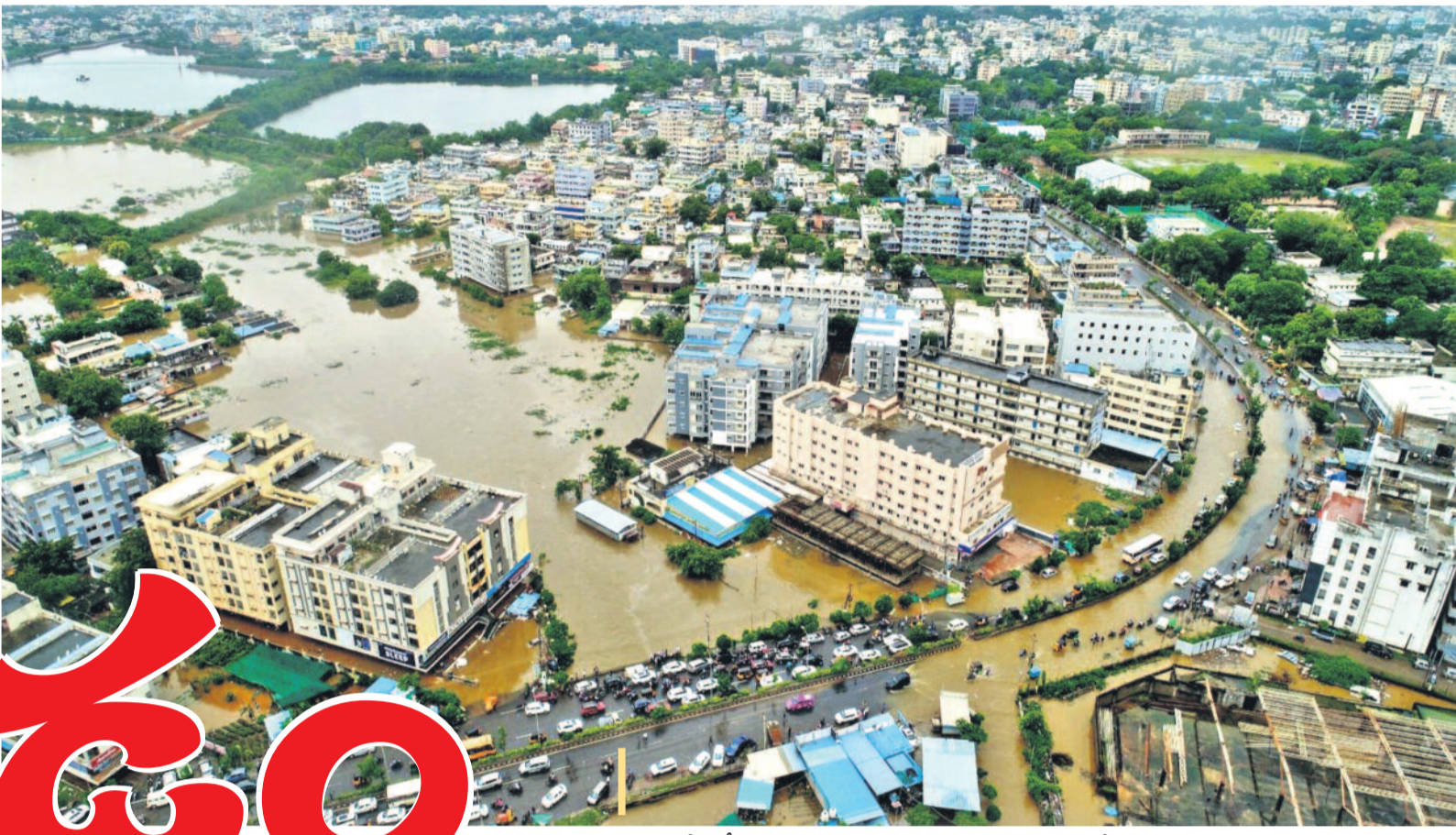
వరద నీటిలో చిక్కుకుపోయిన ఖమ్మం ప్రధాన రహదారి, పలు కాలనీలు