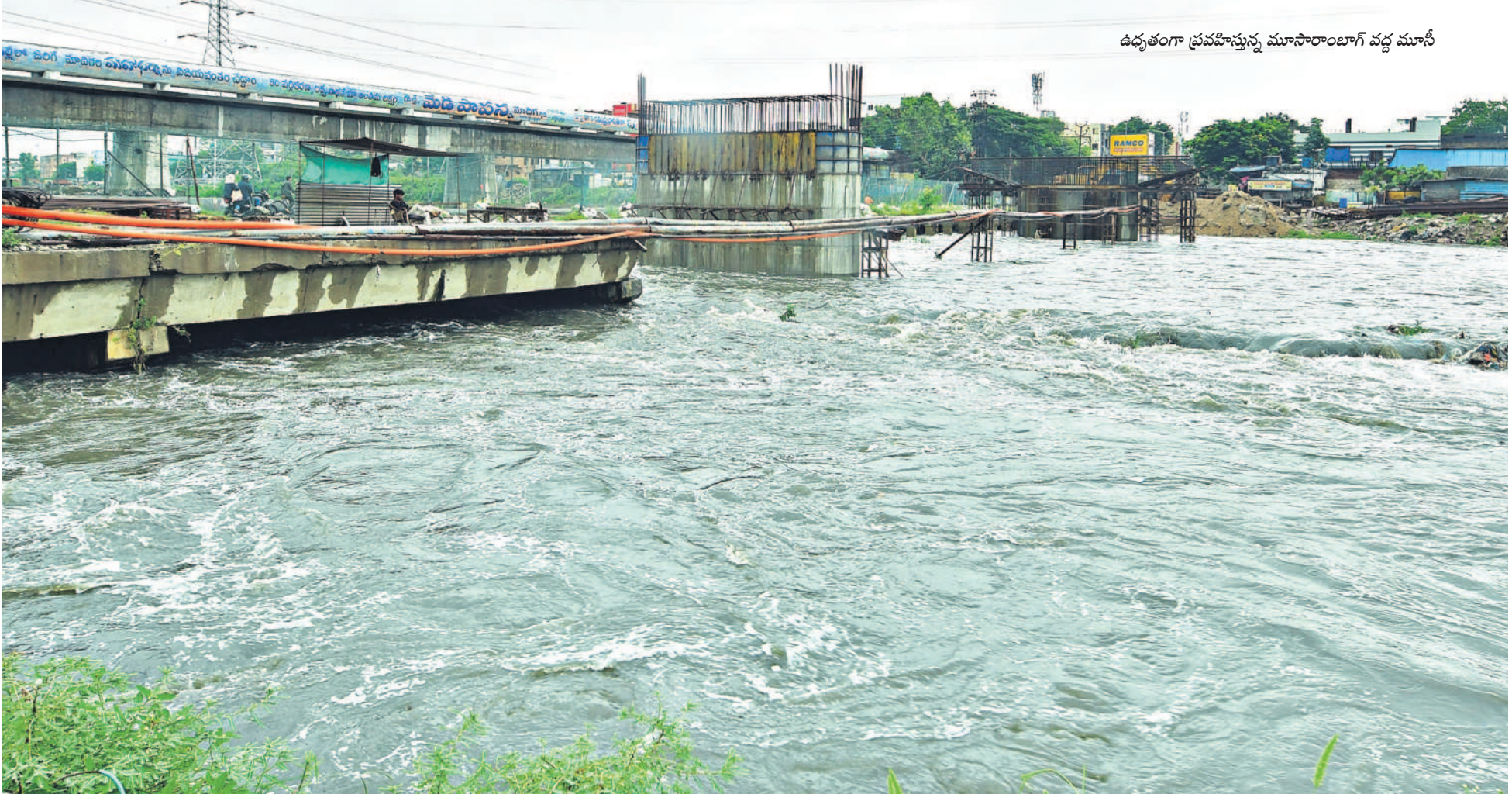
ఉధృతంగా ప్రవహిస్తున్న మూసారాంబాగ్ వద్ద మూసే