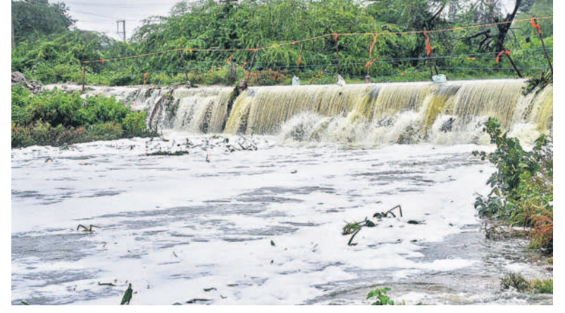
అలుగు పారుతున్న నాచారం చెరువు