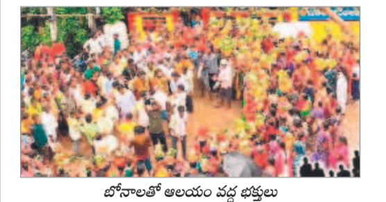
బోనాలతో ఆలయం వద్ద భక్తులు

చెన్నైలో టౌన్, సెప్టెంబర్ 1 : చెన్నైలోని పట్టణంలో ఆదివారం మహంకాళి బోనాలు భక్తిశ్రద్ధలతో నిర్వహించారు. శ్రావణమాసం చివరి ఆదివారం అమ్మవారికి బోనాలు సమర్పించడం ఆనవాయితీగా వస్తున్నది. అమ్మవారికి నైవేద్యం సమర్పించారు. ఇంటింటా బోనంతో స్నానం అంబేద్కర్ చౌక్ నుంచి పెద్ద ఎత్తున పట్టణ పురపీఠం గుండా మహంకాళి ఆలయానికి ఊరేగింపుగా వెళ్లారు. ఆలయ కమిటీ సభ్యులు, నాయకులు, పట్టణ ప్రజలు పాల్గొన్నారు.