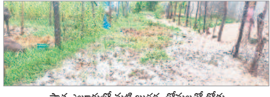
పాత ఎల్లూరులో మట్టి బురద, దోమలతో రోడ్లు

పెండ్లకొండ, సెప్టెంబర్ 1 : మండలంలోని ఎల్లూరులో విష జ్వరాలు ప్రబలతున్నాయి. రెండు రోజుల నుంచి కురుస్తున్న వర్షాలకు గ్రామంలో పారిశుధ్యం లోపించింది. పలు అంతర్గత రోడ్లు మోకాలు లోతు బురదమయంగా మారాయి. మురుగునీరు చేరి దోమలు వృద్ధి చెందాయి. దోమల మందు పిబిటి, క్లోరినేషన్ చేయకపోవడంతో ప్రభావం తీవ్రమైంది. దీంతో గ్రామంలో టైఫాయిడ్, మలేరియా, నాలుగైదు డెంగ్యూ కేసులు కూడా నమోదయ్యాయి. దవాఖానల్లో చికిత్స పొందుతున్నారు. పారిశుధ్యంపై పంచాయతీ కార్యదర్శి పలుమార్లు విన్నవించినా పట్టణమకోవడంలేదని గ్రామస్థులు ఆవేదన వ్యక్తం చేస్తున్నారు. కనీసం వైద్య శిబిరాలు కూడా నిర్వహించడం లేదని వాపోతున్నారు.