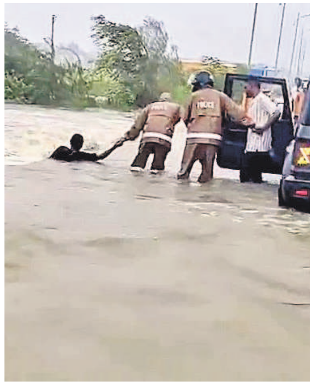
నాగర్ కర్నూల్ లోని నాగనూరి వాగులో కొట్టుకుపోతున్న వ్యక్తిని కాపాడుతున్న పోలీసులు