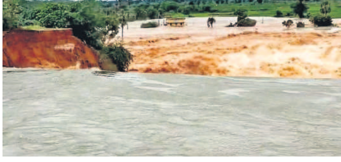
సూర్యాపేట జిల్లా నడిగూడెం మండలంలో సాగర్ ఎడమ కాల్వకు పడిన గండ్

ఎమ్మెల్యేలు స్థానికంగా ఉంటూ సహాయక కార్యక్రమాలు చేపట్టాలని ఆదేశించారు. 24 గంటలు అలర్ట్ గా ఉంటూ సహాయ కార్యక్రమంలో పాలుపంచుకోవాలని కాంగ్రెస్ కార్యకర్తలను దేవతారెడ్డి కోరారు. వరద నష్టపై ప్రధాని ఆరా సీఎం రిపాట్ రెడ్డికి ప్రధానమంత్రి నేరం ద్రవం నడి తీరం వెంబడి అధికారులు 24/7 అలర్ట్ గా ఉంటూ సహాయక కార్యక్రమాలను నిర్వహించాలని ఆదేశించారు. భారీ వర్షాలతో వచ్చిన వరద నీటిని వృథా చేయకుండా భవిష్యత్తు అవసరాలకు వినియోగించుకోవాలని ఆదేశించారు. నంది, గాయత్రి పంపిణీని ఆదివారం లిఫ్ట్ చేసి రిజర్వాయర్లు నింపాలని ఆదేశించారు. మంత్రులు, ఎంపీలు, ఎమ్మెల్యేలు,