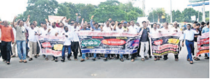
రాల్సీలో పాల్గొన్న ఉద్యోగులు, ఉపాధ్యాయులు