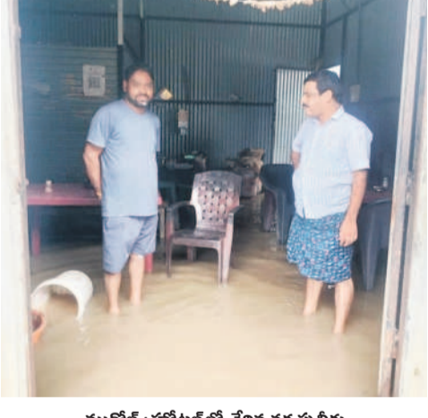
ముధోల్ : హోటల్ లో చేరిన వర్షపు నీరు