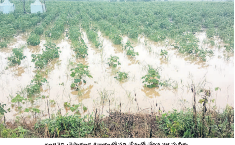
ఇంద్రవైట్ : కిన్నెగూడ శివారలో వల్లి చేసుకోవే చీన వర్షపు నీరు

మహారాష్ట్ర సహా ఎగువ ప్రాంతాల్లో కురుస్తున్న వర్షాలకు ఉమ్మడి జిల్లాలోని ప్రాజెక్టులు జలకళను సంతరించుకున్నాయి. నిర్మల్ జిల్లా కడం ప్రాజెక్టుకు ఎగువ నుంచి భారీగా వరద వచ్చి చేరుతుండడంతో ప్రాజెక్టు పూర్తిస్థాయిలో నిండింది. దీంతో ఆదివారం ఉదయం 10 గేట్లు ఎత్తి నీటిని కిందకు వదిలారు. సాయంత్రానికి ఇన్ ఫ్లో తగ్గడంతో ఐదు గేట్లను ఎత్తి నీటిని వదులుతున్నారు. గడ్డెన్నవారి ప్రాజెక్టుకు 15 వేల క్యూసెక్కుల ఇన్ ఫ్లో ఉండగా.. రెండు గేట్లను ఎత్తి ఆడి స్థాయిలో నీటిని కిందకు వదులుతున్నారు. స్వర్ణ ప్రాజెక్టుకు 8 వేల క్యూసెక్కుల ఇన్ ఫ్లో ఉండగా ఇక్కడ కూడా రెండు గేట్లను ఎత్తి