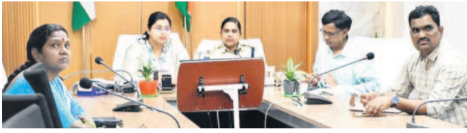
వీడియో కాన్ఫరెన్సులో పాల్గొన్న కలెక్టర్, ఎస్సీ, అధికారులు

నేరడిగొండ మండలంలోని కుంటాల జలపాతానికి భారీగా వరద తాకిడి పెరిగింది. దీంతో జలపాతం వద్ద వరద నీరు ఉప్పాంగి ప్రవహిస్తుంది. వరదనీటితో జలపాతానికి జలకళ సంతరించుకున్నది.