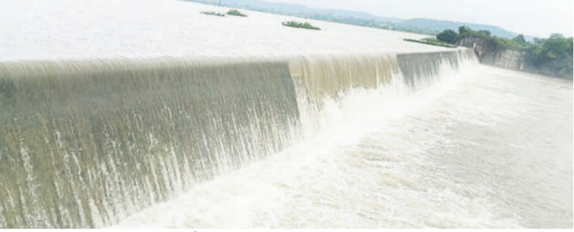
బోధ్ ప్రాజెక్టు అలుగు పారుతున్న దిగు

మంచిర్యాల ప్రతినిధి/ఆదిలాబాద్, సెప్టెంబర్ 1(నమస్తే తెలంగాణ) : ఉమ్మడి ఆదిలాబాద్ జిల్లావ్యాప్తంగా వర్షాలు దంచికొడుతున్నాయి. శనివారం ఆర్ధరాత్రి నుంచి కురుస్తున్న వర్షంతో జనం ఇండ్లు విడిచి బయటికి రావేని పరిస్థితి నెలకొన్నది. ఆదివారం సాయంత్రానికి గడిచిన 24 గంటల్లో ఆదిలాబాద్ జిల్లాలో భీంపూర్ మండలంలోని అర్బీ(టీ)లో అత్యధికంగా 133.8 మిల్లీమీటర్లు, ఆదిలాబాద్(అర్బన్)లో 124.0 మిల్లీమీటర్ల వర్షం కురిసింది. నిర్మల్ జిల్లా కుభీర్ మండలంలో 128.5 మిల్లీమీటర్ల వర్షపాతం నమోదైంది. ఆదిలాబాద్ జిల్లా నార్కట్ పల్లిలో 92.3, జైన్పల్లిలో 90.4, తాంసిలో 88.0, బోడోలో 87.6, సిరిసిందలలో 87.3, సానాలలో 84.0, ఇండ్లపల్లి, బజార్పాతూర్, ఉట్కూర్, తలమడుగు మండలాల్లో భారీ వర్షం పడింది. నిర్మల్ జిల్లా భైంసాలో 89.3, కుంటూరులో 79.8, భైంసాలో 75.8, నిర్మల్లో 73.3 మిల్లీమీటర్లు.. ఆసిఫాబాద్ జిల్లా రెవెన్యూలో 87.8, కాగజేనగర్ మండలంలోని జంబుగాలో 72.2, ఆసిఫాబాద్లో 71.0, లింగాపూర్, కెరిమెరిలో 68 మిల్లీమీటర్ల వర్షపాతం నమోదైంది. మంచిర్యాల జిల్లాలో మోస్తరు వర్షం కురిసింది. జైపూర్ మండలంలో 60.5 మిల్లీమీటర్ల అత్యధిక వర్షపాతం నమోదైంది.