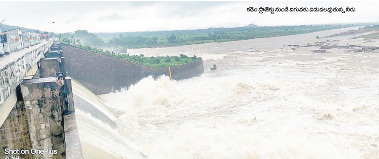
కడం ప్రాజెక్టు నుండి దిగువకు విడుదలవుతున్న నీరు