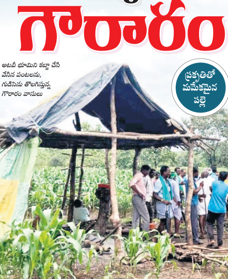
అటవీ భూమిని కట్టా చేసి వేసిన పంటలును, గుడిసెను తొలగిస్తున్న గౌరవం వాసులు

అక్షయం కోండలు.. కనమూపు మేర ఆదర్శం.. ప్రకృతితో మమేకమైన బతుకులు.. తరతరాలుగా గౌరవం గ్రామస్థులకు అడవిలో అనుబంధం కొనసాగుతున్నది. ఊరు చుట్టూ ఉన్న అడవి ఆ పల్లెటి ద్వారానే కన్న తల్లిలా ఆదరిస్తున్నది. కానీ, కొందరి స్వార్థం వచ్చిన అడవికి ముప్పుగా మారింది. చెట్లను నరుకుతూ, అటవీ భూములను ఆక్రమించడం గ్రామస్థులను కలిగించింది. దశాబ్దాలుగా ఆదారపడి బతుకుతున్న అడవులను రక్షించుకునేందుకు ఊరు ఊరంతా ఏకమైంది. కట్టాకు గురైన భూముల్లో సాగు చేస్తున్న పంటల్లోకి పశువులను పడవలమే కాకుండా గుడిసెలను ధ్వంసం చేశారు. ప్రకృతిని పరిరక్షించేందుకు పాపస్థు నిబంధితో కలిసి నడం బిగించిన ఆ గ్రామస్థులు ఇతరులకు ఆదర్శంగా నిలిచారు.