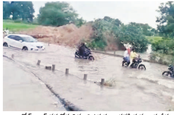
అంకోల్ క్యాంప్ వద్ద రోడ్డు పైనుంచి ఉధృతంగా ప్రవహిస్తున్న వాగు నీరు.. వాహనదారుల తిప్పలు

అత్యంత అప్రమత్తంగా ఉండాలి కలెక్టర్ రాజీవ్ గాంధీ హనుమంతు కంత్వర్, ఆగస్టు 31: భారీ వర్షాలతో అప్రమత్తంగా ఉండాలని నిజామాబాద్ కలెక్టర్ రాజీవ్ గాంధీ హనుమంతు సూచించారు. అధికారులందరూ అందుబాటులో ఉండాలని, ఎక్కడా ప్రాణ, ఆస్తి నష్టం లేకుండా చూడాలన్నారు. భారీ వర్షాల నేపథ్యంలో కలెక్టర్ అన్ని శాఖల అధికారులతో శనివారం సెల్ కార్యక్రమం నిర్వహించారు. చెరువులు, కుంటలు లోకి చేరి వరదనీటిని ఎప్పుడైతే పరిశీలించాలని, ఎక్కడ కూడా గండ్లు పడకుండా నిరంతరం పర్యవేక్షించాలని సూచించారు. పంపా యిల్లా కార్యదర్శులు కచ్చితంగా తమ కార్యనిర్వాహక కుటుంబాలని ఆదేశించారు.