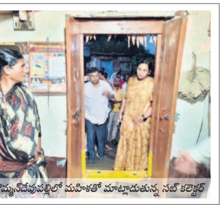
బొమ్మనపల్లిలో మహిళాతో మాట్లాడుతున్న సబ్ కలెక్టర్

బొమ్మనపల్లి జలమయం భారీ వర్షాలతో బొమ్మనపల్లి పట్టణం జలమయమైంది. మధ్యాహ్నం వేళ మొదలైన వర్షంతో పాటు ఉరుములు, మెరుపులు, పిడుగుల హోరుతో ప్రజలు భయాందోళనకు గురయ్యారు. డ్రైయినేజీలు పరిశుభ్రంగా లేకపోవడంతో వర్షపు నీరు ప్రధాన రహదారిపై మెకాకాలి లోతు వరకు నిలిచింది. దీంతో ప్రయాణికులు తీవ్ర ఇబ్బందులకు గురయ్యారు.