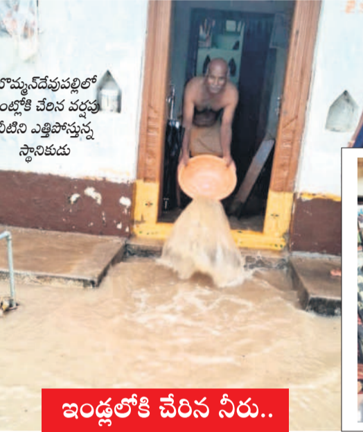
బొమ్మనపల్లిలో ఇంటికి వేలిన వద్దనే నీటిని ఎత్తిపోస్తున్న స్థానికుడు

బొమ్మనపల్లి జలమయం భారీ వర్షాలతో బొమ్మనపల్లి పట్టణం జలమయమైంది. మధ్యాహ్నం వేళ మొదలైన వర్షంతో పాటు ఉరుములు, మెరుపులు, పిడుగుల హోరుతో ప్రజలు భయాందోళనకు గురయ్యారు. డ్రైయినేజీలు పరిశుభ్రంగా లేకపోవడంతో వర్షపు నీరు ప్రధాన రహదారిపై మెకాకాలి లోతు వరకు నిలిచింది. దీంతో ప్రయాణికులు తీవ్ర ఇబ్బందులకు గురయ్యారు.