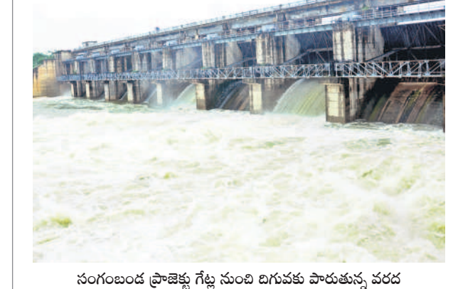
సంగంబండ్ ప్రాజెక్టు కిట్ల నుంచి బిగువకు పారుతున్న వరద

స్థం శ్రీనివాస్ గౌడ్ నిర్మాణంలకు పునరావాసం కల్పిస్తామని ఈ నెల 30 రాత్రి బాధితులకు హామీ ఇచ్చారు. ప్రభుత్వం ఇచ్చే ఇందిరమ్మ ఇండ్ల పథకంలో మీకు ప్రాధాన్యం ఇప్పిస్తామని హామీ ఇచ్చారు. నిర్మాణంలకు అలాగే ఫంక్షనల్ హామీ పునరావాసం కేంద్రం ఏర్పాటు చేస్తున్నట్లు ప్రకటించినా.. శుక్రవారం దుప్పట్లు అందించి ఒక పూట భోజనం పెట్టించారు. శనివారం పునరావాసం కేంద్రంలో ఎలాంటి నిర్మాణం లేకపోవడంతో సమాచారం తెలుసుకున్న దివ్యాంగులు, నిరుపేదలు ఈ కేంద్రానికి చేరుకోలేదు. తమకు తెలిసిన వారి ఇండ్లలో, సమీప బంధువుల ఇండ్లలో తలదాచుకున్నారు. బోగన్ లెక్కలు తలస్తారా..? కళ్ళ కన్నీటిని, కాళ్ళ లేని, చిచ్చలు విసవడని, నడవలేని దీని దుస్థితిలో ఉన్న దివ్యాంగులు మాత్రమే సర్వే నెంబర్ 523 క్రిస్టియన్ వల్లి అదర్లనగర్ ప్రాంతంలో ఇండ్లు నిర్మించుకున్నారని బ్లెండేలేమ్ వెల్లెర్ అనేసినట్లు నాయకులు అంటుండగా.. అధికారులు మాత్రం అక్కడ చాలా వరకు నశి, బోగన్ పట్టణంలకు ఇండ్ల నిర్మాణం వేదిక ప్రభుత్వ స్థలాలును కట్టా చేయాలని చూస్తున్నారని అంటున్నారు. ఇదిలా ఉండగా మరకల్లో మధ్యపర్ల ద్వారా భూమి పట్టణం కొనుగోలు చేసి తాము నష్టపోయామని ఆవేదన వ్యక్తం చేస్తున్నారు. ఈ వ్యవహారంలో ప్రజా ప్రతినిధులు, రెవెన్యూ అధికారుల మద్దతుతో కొందరు దూరాలు, మధ్యపర్లలు కలిపి భూ మాఫీ యాగ ఏర్పడి ప్రభుత్వ భూమి క్రయవిక్రయాలకు పాల్పడ్డారనే ఆరోపణలు ఉన్నాయి.