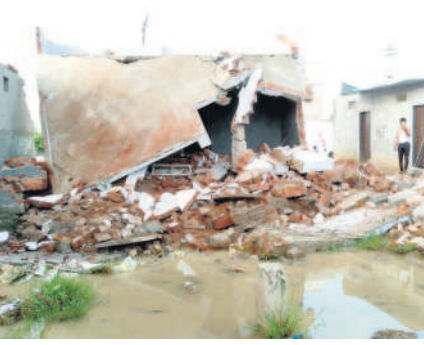
అదర్లనగర్ లో నేలమట్టమైన ఇల్లు

మహబూబ్ నగర్ మున్సిపాలిటీ, ఆగస్టు 31 : మహబూబ్ నగర్ పురపాలక పరిషత్ లో క్రిస్టియన్ వల్లి సర్వే నెంబర్ 523 లో ఈనెల 28న అర్ధరాత్రి సమయంలో ఎలాంటి సమాచారం లేకుండా వేదల ఇండ్ల కూలగొట్టడం తీవ్ర దుమారం యంతో దివ్యాంగులు, దళితులు, నిరుపేదలకు న్యాయం చేస్తారా? సమస్యకు పరిష్కారం చూపకుండా నాన్ను తారా? అనేది ఉమ్మడి పాలమూరుతోపాటు రాష్ట్ర వ్యాప్తంగా చర్చనీయాంశంగా మారింది. పట్టణం, కాలగొట్టడం కొరత పోయిందే.. కాంగ్రెస్ ప్రభుత్వ హయాంలోనే పట్టణం ఇచ్చి అదే ప్రభుత్వం అక్కడ కట్టుకున్న ఇండ్లను కూలగొట్టడం తీవ్ర దుమారం రేపిస్తోంది. నోటీసులు లేకుండా ఇల్లు కూలగొట్టాలని చట్టంలో ఎక్కడా లేదు. కానీ అధికారులు ఎలాంటి నోటీసులు లేకుండా ఇండ్లను కూలగొట్టారని బాధితులు వాపోతున్నారు. డబ్బు, పరిపతి ఉండే వారికి నోటీసులు ఇచ్చి సమయం ఇస్తున్నా అని కారులు వేదల విషయంలో అలా ఎందుకు వ్యవహరించలేదనే ప్రశ్నలు ఉత్పన్నమవుతున్నాయి. ఇది కేవలం రాజకీయ కక్షనా దింపు చర్యగా పలు సంఘాలు అభివ్యక్తిస్తున్నాయి. పట్టణం నిజమైనవి కాకపోతే విచారణ చేసి బాధ్యులపై చర్యలు తీసుకో