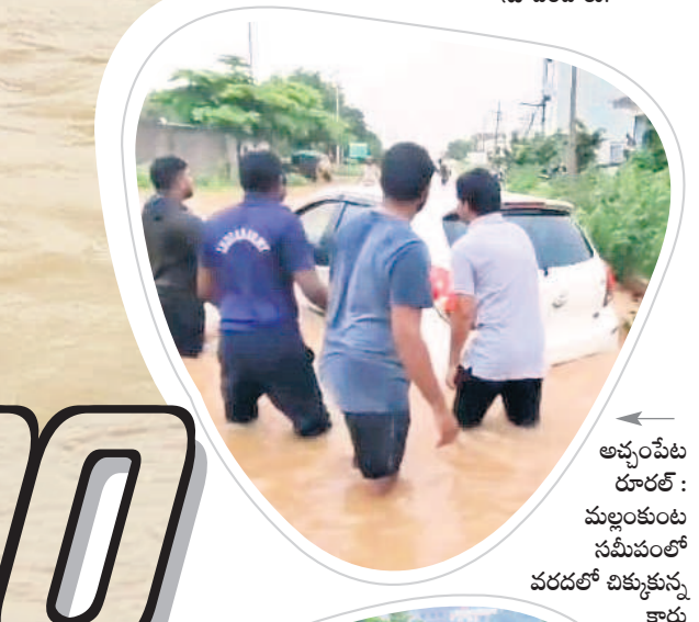
అచ్చంపేట రూరల్ : మల్లంకుంట సమీపంలో వరదలో చిక్కుకున్న కారు

అత్యవసర పరిస్థితుల్లో ప్రజలు డయల్ 100కు కూడా ఫోన్ చేయొచ్చని ఎస్పీలు ప్రజలకు విజ్ఞప్తి చేశారు. కృష్ణానది ప్రమాదకరంగా ప్రవహిస్తుండడంతో అప్రమత్తంగా ఉండాలని పోలీసులు సూచించారు. వాగులు, వంకలతోపాటు కాళివేల వద్ద పహారా కాశారు. రెవెన్యూ అధికారుల సమన్వయంతో రహదారులపై వాగులు పొంగుతున్న చోట్ల ప్రజలను దాటనివ్వకుండా చర్యలు తీసుకుంటున్నారు. మరోవైపు మున్సిపల్ అధికారులు కూడా అప్రమత్తమయ్యారు. వైద్య సిబ్బంది నిత్యం సేవలందించేందుకు సిద్ధంగా ఉండాలని వైద్య, ఆరోగ్యశాఖ అధికారులు సూచించారు. ప్రజలు అత్యవసరమైతే తప్పా బయటకి రావద్దని అధికారులు సూచిస్తున్నారు. లోతట్టు ప్రాంతాల ప్రజలను సురక్షిత ప్రాంతాలకు తరలించేందుకు సిద్ధంగా ఉండాలని మహబూబ్ నగర్ జిల్లా కలెక్టర్ విజయేంద్ర బోయి ఆదేశించారు. అవసరమైతే ప్రజలను సురక్షిత ప్రాంతాలకు తరలించి సహాయక చర్యలు చేపట్టాలని సూచించారు.