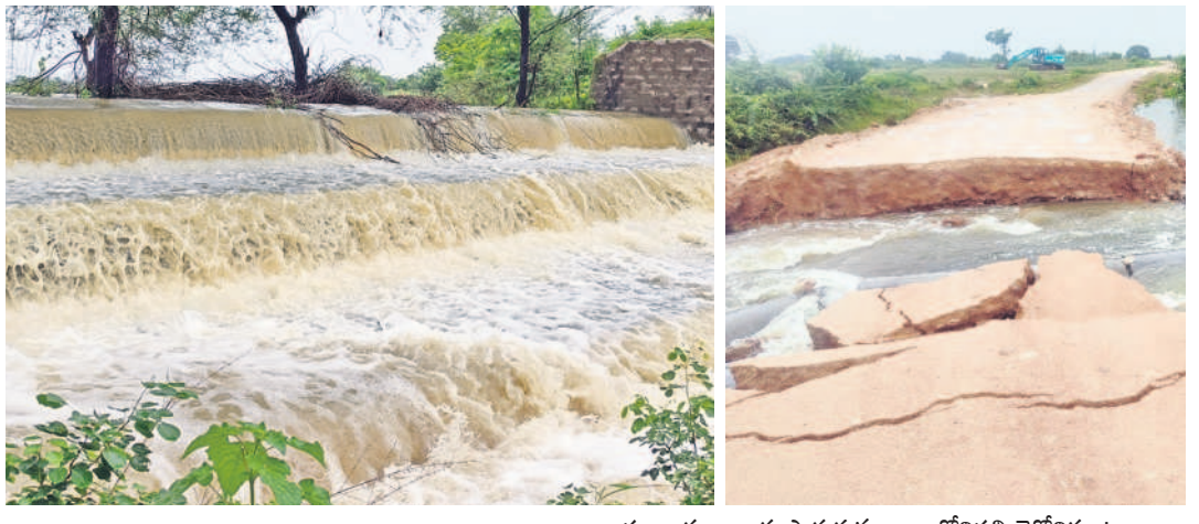
హన్వాడ : అలుగు పారుతున్న నాయనోనిపల్లి టెంపిల్ కుంట, దేవరకల్ల : డోకూర్-దేవరకల్ల మార్గమధ్యంలో కోతకు గురైన రహదారి

కంట్రోల్ రూం నంబర్లు.. మహబూబ్ నగర్ : 08542-241165 నారాయణపేట : 9154283914 జోగుకొండ గద్దాల : 9100901605 వనపర్తి : 08545-233525, 08545-220351 నాగర్ కర్నూల్ : 08540-230201