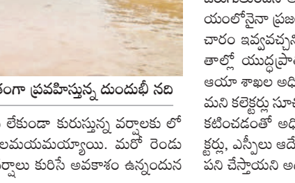
ఇద్దర్ల : కోడల్ల శివారులో ఉధృతంగా ప్రవహిస్తున్న దుండుబి నది

యా. నాగర్ కర్నూల్ జిల్లా కోడేరు మండలం భావాయిపల్లి వాగు నిండుగా ప్రవహిస్తుండడంతో రాకపోకలు నిలిచిపోయాయి. కొల్హూర్ సమీపంలో పెద్దవాగు పొంగడంతో ముక్కిడిగుండం-కొల్హూర్ మధ్య రాకపోకలు బండ్ అయ్యాయి. కొత్తపల్లె-ఇప్రంపల్లి గ్రామాల మధ్య ఉన్న వాగు ఉధృతంగా ప్రవహిస్తుండడంతో ఆయా గ్రామాల మధ్య రహదారి వ్యవస్థ నిలిచిపోయింది. ఇద్దర్లలో కురిసిన భారీ వర్షాలతో రహదారులు మొత్తం జలయముమయ్యాయి. పట్టణం సమీపంలోని వంద పడకల డిమాన్డారితో జలదిగ్బంధంలో చిక్కుకున్నది. మహబూబ్ నగర్ జిల్లా శీల