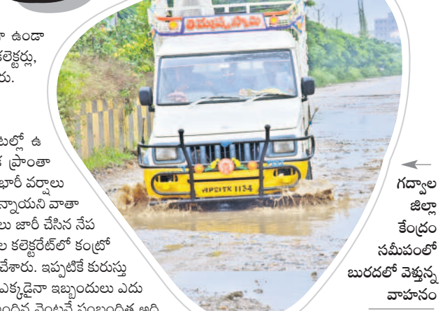
గద్దాల జిల్లా కేంద్రం సమీపంలో బురదలో వెళ్తున్న వాహనం

ప్రజలు అప్రమత్తంగా ఉండాలని ఆయా జిల్లాల కలెక్టర్లు, ఎస్పీలు సూచిస్తున్నారు. ఉమ్మడి జిల్లాకు భారీ వర్షాలతో రానున్న 72 గంటల్లో ఉమ్మడి జిల్లాలో అనేక ప్రాంతాల్లో భారీ నుంచి అతి భారీ వర్షాలు కురిసే అవకాశాలు ఉన్నాయని వాతావరణ శాఖ హెచ్చరికలు జారీ చేసిన నేపథ్యంలో ఆయా జిల్లాల కలెక్టర్లలో కండ్లలో రూంల ఏర్పాటు చేశారు. ఇప్పటికే కురుస్తున్న భారీ వర్షాల వల్ల ఎక్కడైనా ఇబ్బందులు ఏదురైతేనేమీ సాయం అందిన వెంటనే సంబంధిత అధికారులను అప్రమత్తం చేసి సహాయక చర్యలు చేపట్టడం జరుగుతుందని ఆయా జిల్లా కలెక్టర్లు తెలిపారు. ఏ సమయంలోనైనా ప్రజలు ఫోన్ ద్వారా కంట్రోల్ రూంలకు సమాచారం ఇవ్వవచ్చని సూచిస్తున్నారు. వర్ష ప్రభావిత ప్రాంతాల్లో యుద్ధప్రాతిపదికన సహాయక చర్యలు చేపట్టాలని ఆయా శాఖల అధికారులు, సిబ్బందిని అప్రమత్తం చేశారు. కలెక్టర్లు, ఎస్పీలు ఆదేశించారు. ఈ కంట్రోల్ రూంలకు 24/7 పని చేసేయని అధికారులు ప్రకటించారు.