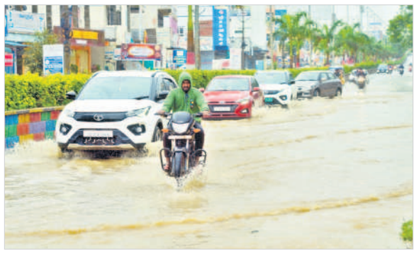
నాగర్ కర్నూల్ లో నిలిచిన నీటిలో వెళ్తున్న వాహనాలు, హన్వాడ : పాతవల్లి వాగును ప్రాకారం సాయంతో దాటుతున్న స్థానికులు, మలకల్ : ఇంట్లోకి వచ్చిన నీరు, ఇద్దర్ల : తండ్రివల్లి రోడ్డుపై రాకపోకలను నిలిపివేసిన దృశ్యం

ఉమ్మడి జిల్లాలో అనేక చోట్ల భారీ వర్షాలకు కాల్వలు తెగిపోయి పంటలకు నష్టం వాటిల్లింది. ఊటూరు మండలంలో చెరువులు నిండడంతో పరి పంట నీటిలో కొట్టుకుపోయింది. ఇదే మండలంలో సోమేశ్వరంబండ్ నుంచి మత్తేరుకు వస్తుండగా మల్లేపల్లి వద్ద కారు వాగులో చిక్కుకున్నది. డోకూర్ నుంచి దేవరకల్లకు వచ్చే దారిలో రోడ్డు తెగిపోవడంతో రాకపోకలు పరి అయ్యాయి. మత్తేరు నియోజకవర్గ వ్యాప్తంగా భారీవర్షం కారణంగా వాగులు, వంకలు పొంగిపొరుగుండడంతోపాటు మత్తడి దుంకు తున్న చెరువులతో పలు గ్రామాలకు రాకపోకలు నిలిచిపోయాయి.