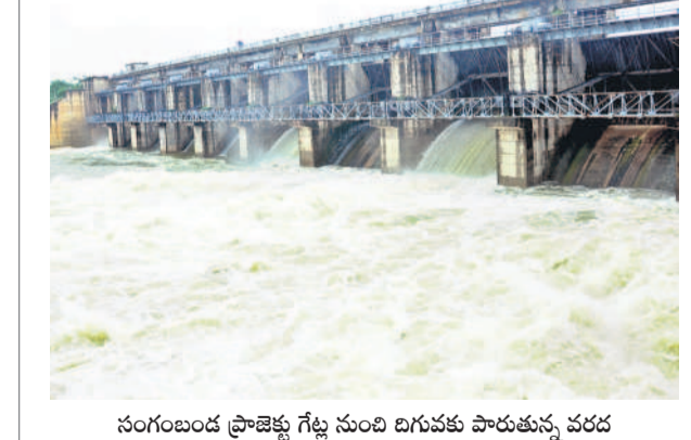
సంగంబండ్ ప్రాజెక్టు కిట్ల నుంచి బిగువకు పారుతున్న వరద