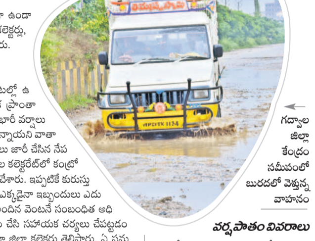
గద్వాల జిల్లా కేంద్రం సమీపంలో బురదలో వెళ్తున్న వాహనం

వర్ష పాతం వివరాలు జోగుళాంబ గద్వాల జిల్లాలో 33.6 మిల్లీమీటర్ల వర్షపాతం నమోదుకాగా.. అత్యధికంగా జిల్లాలో మండలంలో 53.2 మి.మీ., అత్యల్పంగా అయిజ మండలంలో 12.2 మి.మీ. నమోదైంది. నాగర్ కర్నూల్ జిల్లాలో శనివారం ఉదయం వరకు 52.3 మి.మీ., అత్యధికంగా అల్లూరికల్ మండలంలో 74.8 మి.మీ., అత్యల్పంగా ఏలూరు మండలంలో 1.8 మి.మీ., శనివారం సాయంత్రం వరకు 55.44 మి.మీ. కురిసింది. మహబూబ్ నగర్ జిల్లాలో 47.9 మి.మీ. నమోదు కాగా.. అత్యధికంగా కొత్తంట్ల మండలంలో 88.2 మి.మీ. అత్యల్పంగా బాలాసగర్ మండలంలో 26.8 మి.మీ., నారాయణపేట జిల్లాలో 68.1 మి.మీ. వర్షపాతం నమోదు కాగా.. అత్యధికంగా మరకల్లో 138.06 మి.మీ., అత్యల్పంగా కృష్ణలో 20.6 మి.మీ. నమోదైంది. వనపర్తి జిల్లాలో 47.7 మి.మీ. నమోదు కాగా.. అత్యధికంగా రేపల్లిలో 77.6 మి.మీ., అత్యల్పంగా చిన్నబావిలో 21.8 మి.మీ. నమోదైంది.