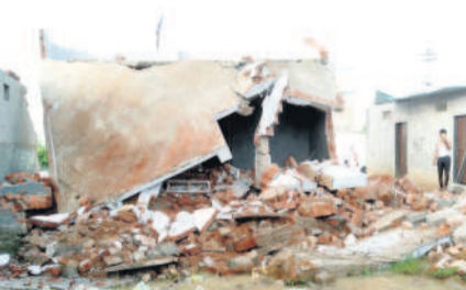
అదర్లనగర్ లో నేలమట్టమైన ఇల్లు

మహబూబ్ నగర్ మున్సిపాలిటీ, ఆగస్టు 31 : మహబూబ్ నగర్ పురపాలక పరిషత్ లోని క్రిస్టియన్ వల్లి సర్వే నెంబర్ 523 లో ఈనెల 28న అర్ధరాత్రి సమయంలో ఎలాంటి సమాచారం లేకుండా పేదల ఇండ్ల కూలగొట్టి నిరాశ్రయులను చేసిన విషయంలో దివ్యాంగులు, దళితులు, నిరుపేదలకు న్యాయం చేస్తారా? సమస్యకు పరిష్కారం చూపకుండా నాన్ను తారా? అనేది ఉమ్మడి పాలమూరుతోపాటు రాష్ట్ర వ్యాప్తంగా చర్చనీ అంశంగా మారింది. పట్టణం, కాలగొట్టం కాలెండ్రి హయాంలోనే.. కాంగ్రెస్ ప్రభుత్వ హయాంలోనే పట్టణం ఇచ్చి అదే ప్రభుత్వం అక్కడ కట్టుకున్న ఇండ్లను కూలగొట్టడం తీవ్ర దుమారం రేపిస్తోంది. నోటీసులు లేకుండా ఇల్లు కూలగొట్టాలని పట్టణం ఎక్కడా లేదు. కానీ అధికారులు ఎలాంటి నోటీసులు లేకుండా ఇండ్లను కూలగొట్టారని బాధితులు వాపోతున్నారు. డబ్బు, పరిపతి ఉండే వారికి నోటీసులు ఇచ్చి సమయం ఇస్తున్నారని భావిస్తున్నారని బాధితులు అభిప్రాయపడుతున్నారు. ఇది కేవలం రాజకీయ కక్షనా దింపు చర్యగా పలు సంఘాలు అభిప్రాయపడుతున్నాయి. పట్టణం నిజమైనవి కాకపోతే విచారణ చేసి బాధ్యులపై చర్యలు తీసుకో