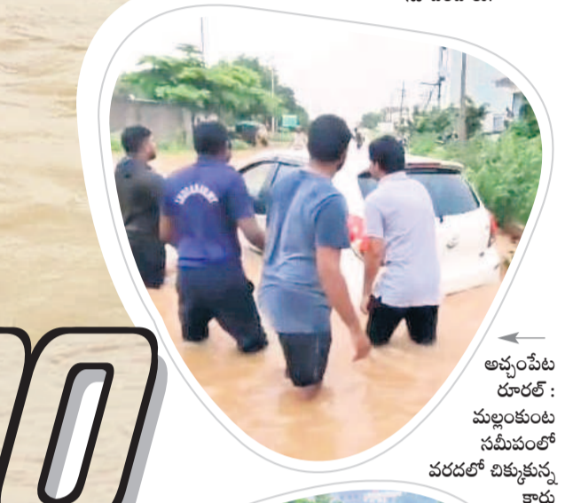
అచ్చంపేట రూరల్ : మల్లంకుంట సమీపంలో వరదలో చిక్కుకున్న కారు

అత్యవసర పరిస్థితుల్లో ప్రజలు డయల్ 100కు కూడా ఫోన్ చేయొచ్చని ఎస్పీలు ప్రజలకు విజ్ఞప్తి చేశారు. కృష్ణానది ప్రమాదకరంగా ప్రవహిస్తుండడంతో అప్రమత్తంగా ఉండాలని పోలీసులు సూచించారు. వాగులు, వంకలతోపాటు కాళివేల వద్ద పహారా కాశారు. రెవెన్యూ అధికారుల సమన్వయంతో రహదారులపై వాగులు పొంగుతున్న చోట్ల ప్రజలను దాటనివ్వకుండా చర్యలు తీసుకుంటున్నారు. మరోవైపు మున్సిపల్ అధికారులు కూడా అప్రమత్తమయ్యారు. వైద్య సిబ్బంది నిత్యం సేవలందించేందుకు సిద్ధంగా ఉండాలని వైద్య, ఆరోగ్యశాఖ అధికారులు సూచించారు. ప్రజలు అత్యవసరమైతే తప్పా బయటకి రావద్దని అధికారులు సూచించారు. లోతట్టు ప్రాంతాల ప్రజలను సురక్షిత ప్రాంతాలకు తరలించేందుకు సిద్ధంగా ఉండాలని మహబూబ్ నగర్ జిల్లా కలెక్టర్ విజయేంద్ర బోయి ఆదేశించారు. అవసరమైతే ప్రజలను సురక్షిత ప్రాంతాలకు తరలించి సహాయక చర్యలు చేపట్టాలని సూచించారు.