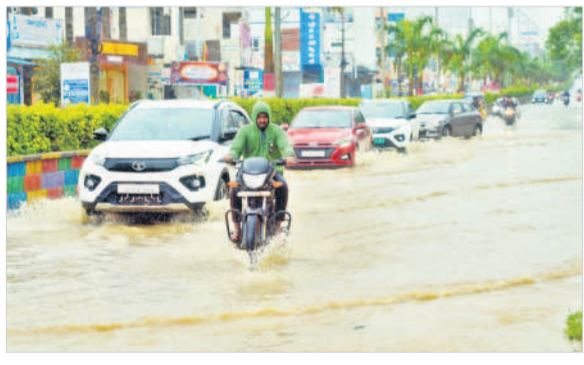
నాగర్ కర్నూల్ లో నిలిచిన నీటిలో వెళ్తున్న వాహనాలు, ధన్వాడ : పాతవల్లి వాగును ప్రాకారం సాయంతో దాటుతున్న స్థానికులు, మలకల్ : ఇంట్లోకి వచ్చిన నీరు, ఇద్దర్ల : తండ్రివల్లి రోడ్డుపై రాకపోకలను నిలిపివేసిన దృశ్యం

ఉమ్మడి జిల్లాలో అనేక చోట్ల భారీ వర్షాలకు కాలాలు తెగిపోయి పంటలకు నష్టం వాటిల్లింది. ఊటూరు మండలంలో చెరువులు నిండడంతో పరి పంట నీటిలో కొట్టుకుపోయింది. ఇదే మండలంలో సోమేశ్వరంబండ్ నుంచి మత్తేరుకు వస్తుండగా మల్లేపల్లి వద్ద కారు వాగులో చిక్కుకున్నది. డోకూర్ నుంచి దేవరకల్లకు వచ్చే దారిలో రోడ్డు తెగిపోవడంతో రాకపోకలు పలు అయ్యాయి. మత్తేరు నియోజకవర్గ వ్యాప్తంగా భారీవర్షం కారణంగా వాగులు, వంకలు పొంగిపొరుగుండడంతోపాటు మత్తడి దుంకు తున్న చెరువులతో పలు గ్రామాలకు రాకపోకలు నిలిచిపోయాయి.