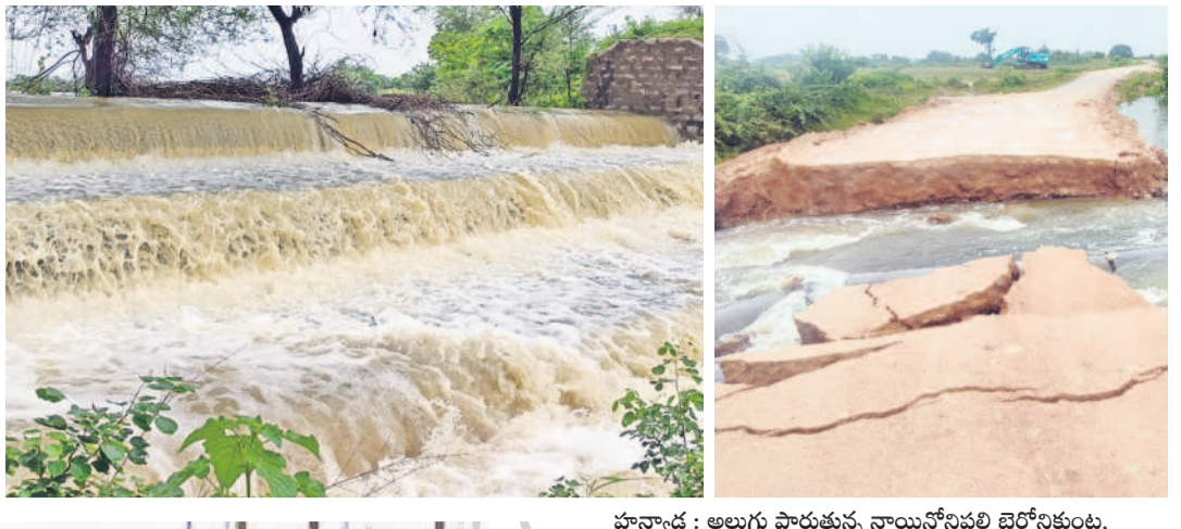
హన్మచి : అలుగు పారుతున్న నాయి నోనువల్లి టెర్రోనికుంట, దేవరకల్ల : డోకూర్-దేవరకల్ల మార్గమధ్యంలో కోతకు గురైన రహదారి