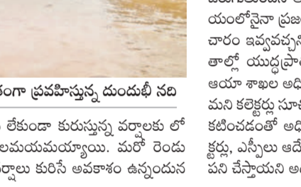
ఇద్దర్ల : కోడల్ల శివారులో ఉద్ధతిగా ప్రవహిస్తున్న దుండుబి నది

యాం. నాగర్ కర్నూల్ జిల్లా కోడేరు మండలం భావాయిపల్లి వాగు నిండుగా ప్రవహిస్తుండడంతో రాకపోకలు నిలిచిపోయాయి. కొల్హూర్ సమీపంలో పెద్దవాగు పొంగడంతో ముక్కిడిగుండం-కొల్హూర్ మధ్య రాకపోకలు బంద్ అయ్యాయి. కొత్తంట్ల-ఇప్రంపల్లి గ్రామాల మధ్య ఉన్న వాగు ఉద్ధతిగా ప్రవహిస్తుండడంతో ఆయా గ్రామాల మధ్య రవాణా వ్యవస్థ నిలిచిపోయింది. ఇద్దర్లలో కురిసిన భారీ వర్షాలతో రహదారులు మొత్తం జలయముమయ్యాయి. పట్టణం సమీపంలోని వంద పడకల డిమాన్డారీ జలదిగ్బంధంలో చిక్కుకున్నది. మహబూబ్ నగర్ జిల్లా శీల