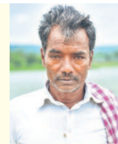
మా బాధలు వట్టింతుకోండి సారూ.. లస్సర్లు విడుదల చేసి దాదాపుగా సంవత్సరం కాలం అవుతున్నది. నిత్యం ఉదయం 10 గంటల నుంచి సాయంత్రం 5 గంటల వరకు విధులు నిర్వహిస్తున్నా. సర్కస్ వద్ద చెరువు కట్టపై కలుపు మొక్కలు తొలగిస్తున్నా. రైతులకు సరఫరా నీటిని క్రమం తప్పకుండా విడుదల చేస్తున్నా. వర్షానికి తడుస్తూ.. ఎండకు ఎందుకూ.. విధులు నిర్వహిస్తున్నా. ఆరు నెలలుగా జీతాలు రాకపోవడంతో దాదాపు రూ. లక్షకు పైగా అప్పు చేసినా. అప్పులు తీసుకొని విధులకు హాజరు కావాల్సిన దుస్థితి ఏర్పడింది. మా బాధలను జర పంట్లించుకోండి సారూ..