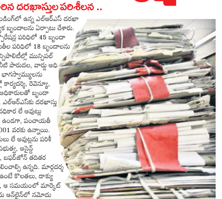
చేయాల్సి ఉంటుంది. ఇందుకు ఒక్కో దరఖాస్తుకు గంట నుంచి రెండు గంటల సమయం పడుతున్నదని అధికారులు చెబుతున్నారు. వివిధ శాఖల అధికారులు వారివారి శాఖల పనులతోనే సతమతమవుతుండగా ఎల్ఆర్ఎస్ దరఖాస్తులను పరిశీలించేందుకు సమయం ధోరణి కలదు. ఈ కారణంగానూ దరఖాస్తుల పరిశీలన ప్రక్రియ ఆగిపోయిన స్థాయిలో ముందుకు సాగడం లేదు.