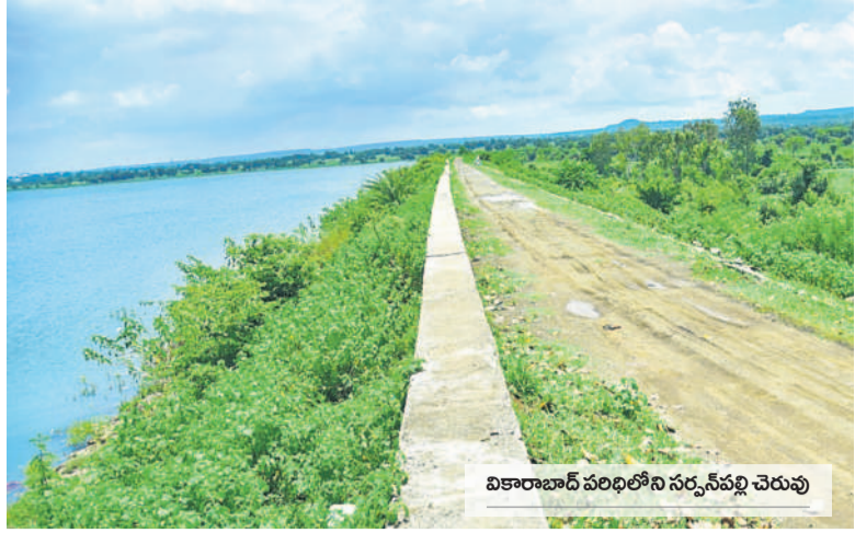
వికారాబాద్ పరిధిలోని సర్కస్ వద్ద చెరువు