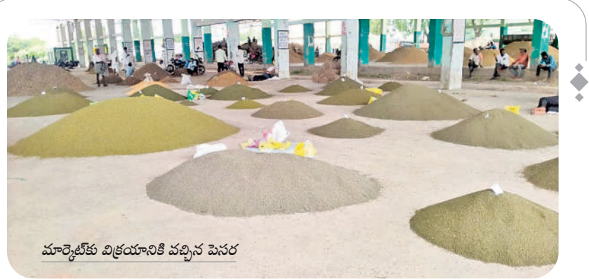
మార్కెట్లో విక్రయానికి వచ్చిన పెసర