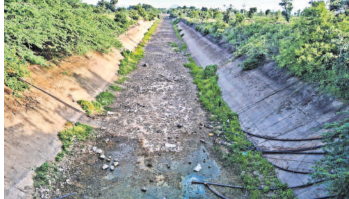
వెలికాల 69 డీవీఎం పరిధిలో ఎస్సార్ సీ కాల్య పరిస్థితి

తిరుమలగిరి, ఆగస్టు 30: ఉమ్మడి నల్ల గొండ జిల్లాలోని ఒకనాటి కరువు ప్రాంతం తిరుమలగిరి.. బీఆర్ఎస్ పాలనలో కాశీశ్వరం జలాల్తో జపనర్తాలు నింపుకొని సస్యశ్యామలమైంది. నీటి చెమ్మ తేలిపోవడంతో తొక్కిన గోదావరి జలాలు అన్నదాత ఇంట సీరుల పంట పండించాయి. కానీ ఆ సంతోషం రైతాంగంలో ఎన్నో ఏండ్లు నిలువలేదు. కాంగ్రెస్ పాలన మళ్ళీ పాతకాలాన్ని గుర్తుచేస్తూ కరువు కోరికల నెడుతున్నది. రేపంతరెడ్డి సర్కారులో గోదావరి జలాలు జాడలేక వానకాలంలోనూ పరిస్థితి ఎండిపోతున్నాయి. చిన్నా ఇప్పటివరకు ఒక్క భారీ వర్షం పడలేదు. ఎస్సార్ సీ కాల్యాల ద్వారా ప్రభుత్వం చెరువయ్యాయి. బీకేపీ వర్షం వచ్చినా, వంకలు వట్టి పోయాయి. బీకేపీ వర్షం వచ్చినా, వంకలు వట్టి పోయాయి. బీకేపీ వర్షం వచ్చినా, వంకలు వట్టి పోయాయి. బీకేపీ వర్షం వచ్చినా, వంకలు వట్టి పోయాయి.