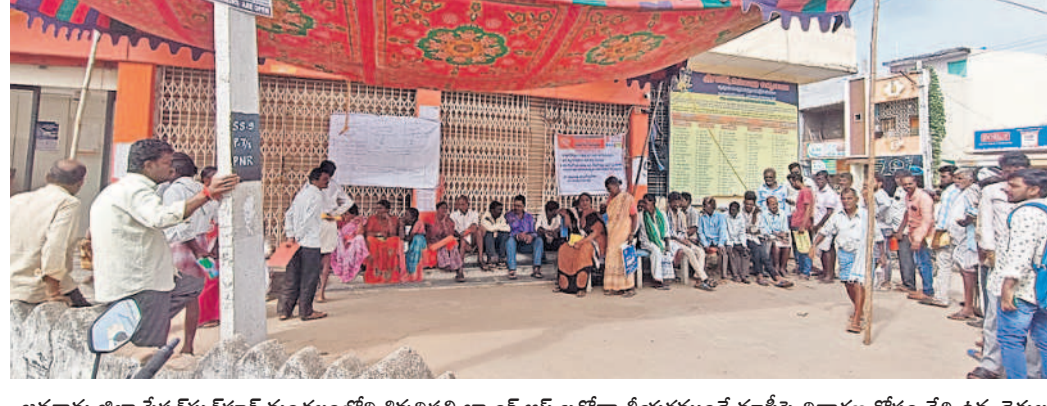
జనగామ జిల్లా స్టేషన్ మార్కెట్ మండలంలోని శివసెట్టి బ్యాంక్ ఆఫ్ బర్దోడా తీయకముందే మాఫీపై విచారణ కోసం వేదిక రైతులు