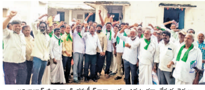
అదిలాబాద్ జిల్లా తాని తహసీల్ కార్యాలయం ఎదుట ధర్నా చేస్తున్న రైతులు