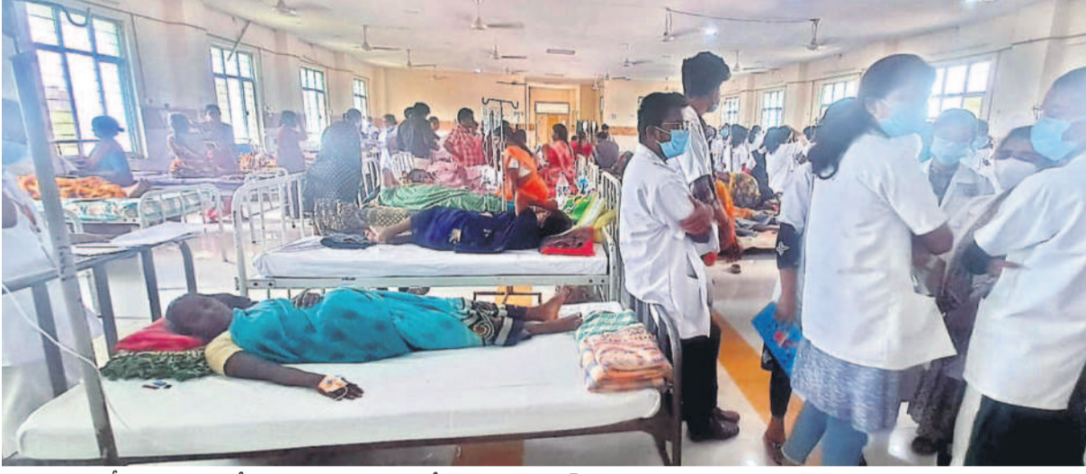
జ్వర వీడితులు, డాక్టర్లతో కిటికిలూడుతున్న సూర్యాపేట ప్రభుత్వ జనరల్ ఆసుపత్రి

సూర్యాపేట జిల్లాలో వైరల్ ఫీవర్, డెంగ్యూ కేసులు విపరీతంగా నమోదు అవుతున్నాయి. ప్రభుత్వ, ప్రైవేట్ ఆసుపత్రులు జ్వర వీడితులతో కిటికిలూడుతున్నాయి. దాదాపు ప్రతి ఇంట్లో ఎవరో ఒకరు జ్వరంతో బాధపడుతున్నారు. సోషల్ మీడియాలో తీస్తున్నారు. గత 29 రోజుల్లోనే జిల్లావ్యాప్తంగా 406 డెంగ్యూ కేసులు నమోదయ్యాయి. ఇక, వైరల్ ఫీవర్ కేసులు లెక్కకు అందని పరిస్థితి. - సూర్యాపేట, ఆగస్టు 29 (నమస్తే తెలంగాణ)