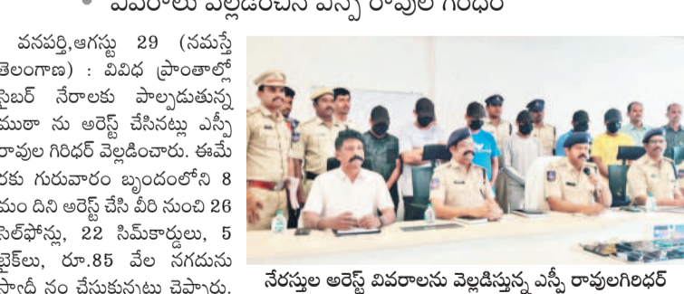
నేరాలను అరెస్ట్ వివరాలను వెల్లడిస్తున్న ఎస్పీ రావుల గిరిధర్