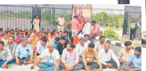
పాలమూరు కలెక్టరేట్ ఎదుట ధర్నా చేస్తున్న బాధితులు

సర్వే నెంబర్ 523లో అక్రమంగా లెక్కాని చేసింది కూడా పేదలే.. పలు దశలుగా విచారణ చేసి పరిశీలించి 75 తాత్కాలిక నిర్మాణాలు ఎవరూ నివాసం లేని ఇండ్లను పోషిస్తూ, రెవెన్యూ, మున్సిపల్ కౌన్సిలు సంయుక్తంగా కూల్చివేశారు. వీటికి ఎలాంటి పట్టాలు రెవెన్యూ అధికారులు జారీ చేయలేదు. కొందరు ఇక్కడ మీరు కట్టుకోండని చెప్పి.. వాళ్లతో డబ్బులు మరూలు చేసి వారికి అమ్మిస్తున్నామని దుస్థితి వచ్చింది.