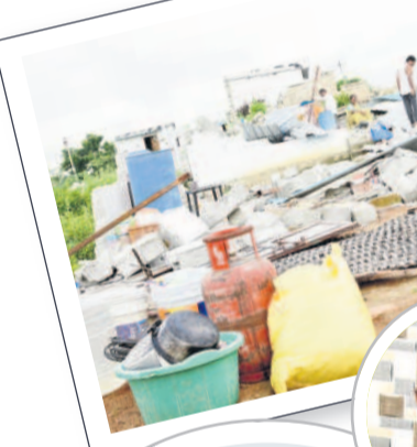
అదర్బనగర్లో నేలమట్టమైన ఇల్లు

చారం ఇప్పుడు ఉన్నా.. సర్వే నెంబర్ 523 ఇండ్ల నిర్మాణాలు కూల్చివేత విషయంపై రెవెన్యూ అధికారులు మాకు సమాచారం ఇవ్వలేదు. బిల్డింగ్ పేజీస్ అనే సివిల్ ఏంజీనింగ్ ఫిజికల్ హ్యాండ్ క్యాన్స్ రిజిస్ట్రేషన్ నెం. 122/79కి 2001లో 83 ప్లాట్లు అప్పట్లో అధికారులు కేటాయించారు. అందుకు, చెప్పరు, మూగ, ఫిజికల్ హ్యాండ్ క్యాన్స్ వాళ్ళ ఇండ్లను కట్టుకోవటం చెప్పారు. వాళ్ళ ఇచ్చిన లేఅవుట్ ప్రకారం ప్రస్తుత నిర్మాణాలు కొనసాగుతున్నాయి.