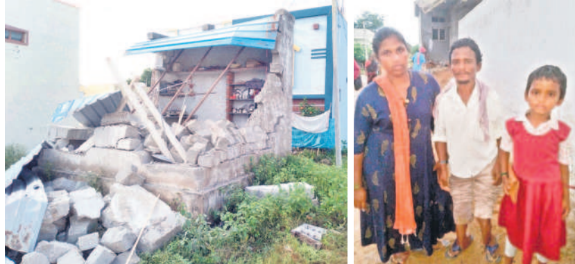
నేలమట్టమైన బోజాన్యాయక్ ఇల్లు భార్య, కూతురుతో బోజాన్యాయక్