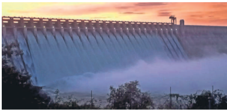
నాగార్జున సాగర్ డ్యామ్ 18 క్రేన్ల గేట్ల ద్వారా కొనసాగుతున్న నీటి విడుదల