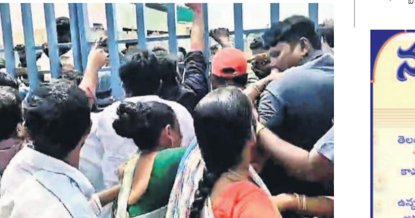
సంగం డెయిరీ వద్ద ఆందోళన చేస్తున్న రైతులు