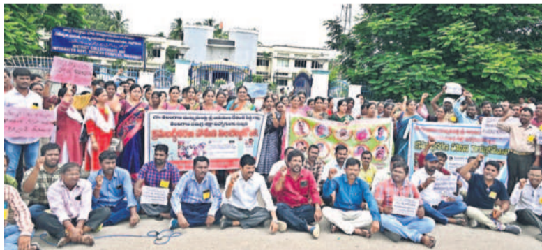
నల్లగొండ కలెక్టరేట్ వద్ద దర్నా చేస్తున్న సమగ్ర శిక్ష ఉద్యోగులు

నందికొండ, ఆగస్టు 28 : నాగార్జునసాగర్ రిజర్వాయర్ వరద ఉధృతి కొనసాగుతుండడంతో డ్యామ్ 18 క్రేన్ల గేట్ల ద్వారా నీటి విడుదల చేస్తున్నారు. శ్రీశైలం నుంచి 1,94,758 క్యూసెక్కుల ఇన్ ఫ్లో వచ్చి చేరుతుండడంతో డ్యామ్ 18 క్రేన్ల గేట్ల ద్వారా 1,45,800 క్యూసెక్కుల నీటిని విడుదల చేస్తున్నారు. ఈ ఏడాదిలో ఆగస్టు 5న క్రేన్ల గేట్ల ద్వారా నీటి విడుదల ప్రారంభించిన 12 వరకు, మళ్లీ 14 నుంచి 19 వరకు నీటిని విడుదల చేశారు. మాజీ సారి ఈ నెల 28వ తేదీన మళ్లీ క్రేన్ల గేట్ల ద్వారా నీటి విడుదలను ప్రారంభించారు. ఇప్పటి వరకు 140 టీఎంసీలను క్రేన్ల ద్వారా విడుదల చేసినట్లు తెలుస్తోంది. డాంట్ పాటు జలవిడుదల కేంద్రాలు, కాల్వల ద్వారా కలిపి మొత్తం 228 టీఎంసీల నీటిని విడుదల చేశారు. బుధవారం ఉదయం రెండు క్రేన్ల గేట్ల ద్వారా నీటి విడుదల కొనసాగుతుండగా శ్రీశైలం నుంచి ఇన్ ఫ్లో పెరుగుతోంది. డ్యామ్ గేట్లను క్రమంగా 18 వరకు తెరుస్తారు.