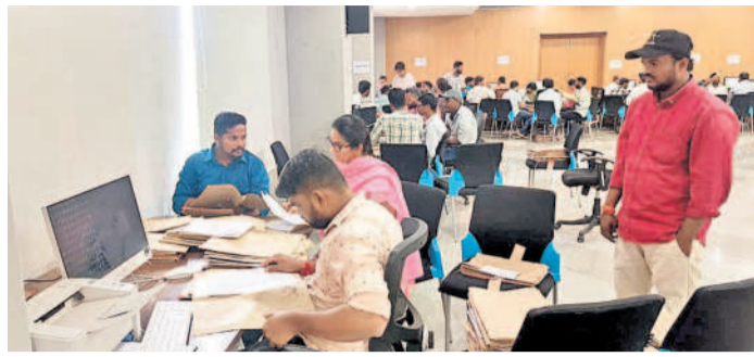
కలెక్టరేట్లో పెండింగ్ దరఖాస్తుల పరిష్కారంపై స్పెషల్ డ్రైవ్ (ఫైల్)

మెడక్, ఆగస్టు 28 (నమస్తెలంగాణ): ధరణి పెండింగ్ దరఖాస్తులను పరిష్కరించేందుకు జిల్లా యంత్రాంగం కనకలక్ష్మి చేస్తుంది. వివిధ రకాల మాడ్యూల్స్ కింద పరిష్కారానికి నోచు కోని దరఖాస్తులు జిల్లాలోని అన్ని మండలాలలో 2,200 పెండింగ్లో ఉన్నాయి. పదిహేను రోజులూ కలెక్టరేట్లోని సమావేశ మందిరంలో అన్ని మండలాలకు చెందిన తహసీల్దార్లు, సిబ్బంది ధరణి స్పెషల్ డ్రైవ్ చేపట్టారు. ప్రభుత్వ చొరవతో గ్రీమ్ఫెస్ట్ మ్యూజర్, వారసత్వ బదిలీలు, భూసేకరణ సమస్యలు, ఖాతాల విలీనం, పెండింగ్ మ్యూటీషన్లు, కోర్టు కేసులు, పాస్ పుస్తకాలు తీసుకువచ్చారు.