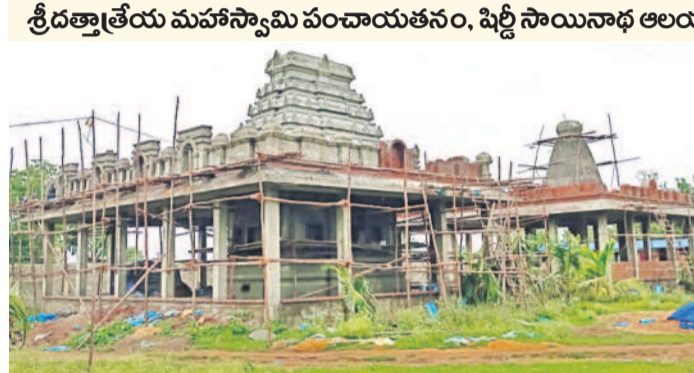
గూడూరులో ముమ్మరంగా జరుగుతున్న శ్రీగురుపీఠం నిర్మాణ పనులు