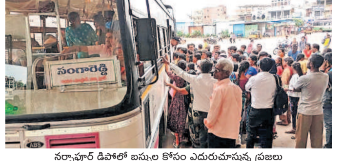
నర్సాపూర్ డిపార్ట్ బస్సుల కోసం ఎదురుచూస్తున్న ప్రజలు