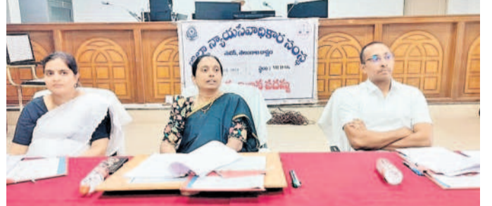
సమావేశంలో మాట్లాడుతున్న జిల్లా ప్రధాన న్యాయమూర్తి లక్ష్మీశారద