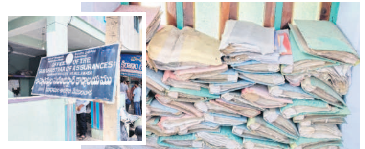
వేములవాడలోని సబ్ రిజిస్ట్రార్ కార్యాలయంలో కిటికీ పక్కన ఉన్న లెక్కల పుస్తకాలు