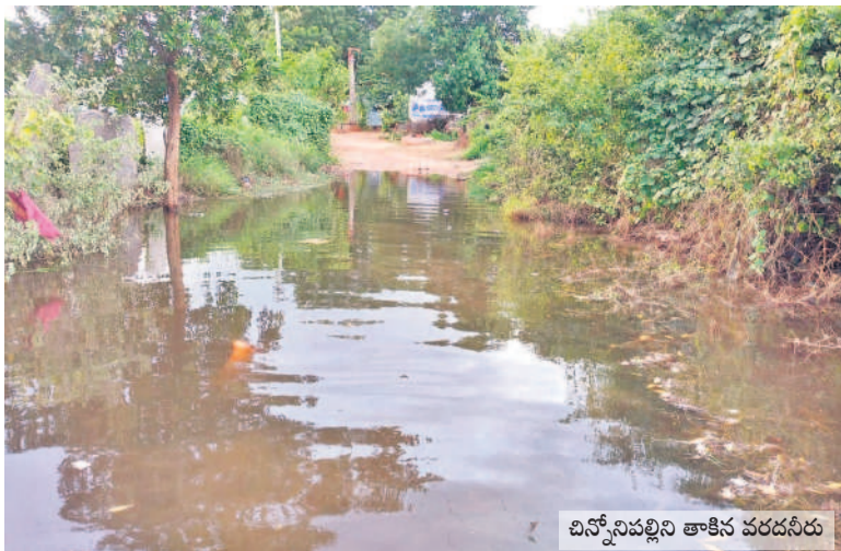
వినోనిపల్లిని తాకిన వరదనీరు

వినోనిపల్లికి జలగండం పొంచి ఉన్నది. ఊరును వరద ముట్టుముట్టడంతో స్థానికుల్లో టెన్షన్.. టెన్షన్ నెలకొన్నది. వర్షాలు కురుస్తుండడంతో సమీపంలో ఉన్న రిజర్వాయర్లో నీటిమట్టం క్రమేపీ పెరుగుతున్నది. ఇప్పటికే ఊరి దలదాపుల్లోకి జలాలు చేరాయి. దీంతో విషపురుగుల తాకిడి పెరిగింది. మళ్లీ భారీ వానలు పడితే ఈసారి ముంపునకు గురికావచ్చింది.. గ్రామాన్ని భాళి చేసి పునరావాస కేంద్రానికి వెళ్లాలని అధికారులు సూచిస్తున్నా.. అక్కడ కనీస సౌకర్యాలు కరువయ్యాయి. ఉమ్మడి రాష్ట్రంలో నిర్మించిన ఈ ప్రాజెక్టుతో సాగునీటికి ఎలాంటి ఉపయోగం లేదని రైతులు పేర్కొంటున్నారు. ఏ సమయంలో ఎలాంటి ఉపద్రవం వస్తుందోనని స్థానికులు భయాందోళన చెందుతున్నారు. దినదినగండంగా జీవనం సాగిస్తున్నామని, ఇప్పటికైనా ప్రభుత్వం పట్టించుకోవాలని వేడుకుంటున్నారు. - గట్టు, ఆగస్టు 28