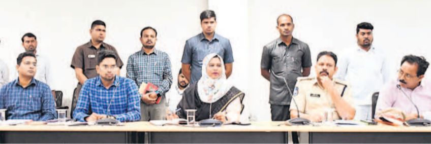
అధికారులతో సమీక్ష నిర్వహిస్తున్న జాతీయ మైనార్టీ కమిషన్ సభ్యులు సయ్యద్ షెహజాద్, పార్టీ నేతలతో సమీక్ష

మైనార్టీ జాతీయ కమిషన్ సభ్యురాలు సయ్యద్ షెహజాద్