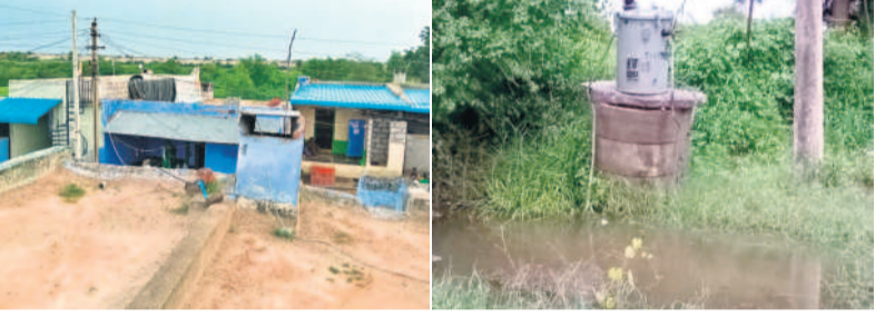
వినోనిపల్లి ముంపు గ్రామం, ఊరి చివర ఉన్న విద్యుత్ సింగిల్ పోస్ట్ ప్రాన్స్ పార్కర్ వద్దకు చేసిన వరద

ముంపు గ్రామం సమీపంలోని ఎర్రగట్టు ప్రాంతంలో పునరావాస కేంద్రం ఏర్పాటు కోసం స్థలాన్ని సేకరించారు. 300 మందిదాకా నిర్వాసితులకు పట్టణం పంపిణీ చేశారు. ఇంకా కొందరికి పట్టణం అందాల్సి ఉన్నది. రోడ్లు, డ్రైనేజీ, అరకొర తాగునీటి వసతి, విద్యుత్ సౌకర్యం అయితే అవసరమైన సౌకర్యాలు కేంద్రంలో ఏర్పాటు కాలేదు. ఈ క్రమంలో తాము అక్కడికి వెళ్లి ఎలా ఉండాలని నిర్వాసితులు ప్రశ్నిస్తున్నారు. రైతులు కోరుతున్న ఇది.. ఎలాంటి ప్రయోజనాలు లేని వినోనిపల్లి రిజర్వాయర్ను రద్దు చేసి భూసేకరణ చేసిన పాలాలపై తమకు హక్కులు కల్పించాలని ఆయా గ్రామాల నిర్వాసితుల రైతులు మొరపెట్టుకుంటున్నారు. ఆంధ్రా ప్రాంతానికి నీటిని తరలించడానికి ఉమ్మడి రాష్ట్ర పాలకులు రూపొందించిన రిజర్వాయర్లతో ఉమ్మడి ఉపయోగం లేదంటున్నారు. ఈ నిర్మాణం కోసం తాము ఎందుకూ పోరాటం చేస్తున్న విషయాన్ని వారు గుర్తు చేశారు. ఆదివేదికగా ఇండ్ల నిర్మాణం పంపిణీ చేసిన కారకుండా తాము ఇప్పటి రిజర్వాయర్ నిర్మాణాలకు ఇస్తున్న ప్యాకేజీని తమకు అమలు చేస్తే ఉపయోగకరంగా ఉంటుందని కోరుతున్నారు. వెండిగోనీ బిల్లులు సైతం ఇంకా రావాల్సి ఉందని నిర్వాసితులు చెబుతున్నారు. ఈ విషయంలో ప్రభుత్వం స్పందించి అందరికీ ఆమోదయోగ్యమైన ప్యాకేజీని అందిస్తే తామంతా గ్రామం విడిచిపెట్టి వెళ్లమని నిర్వాసితులు ఖరాయిండా చెబుతున్నారు.