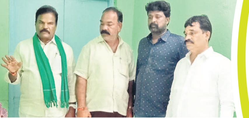
మాట్లాడుతున్న కలకత్తర్ల మాజీ ఎమ్మెల్యే జైపాల్ యాదవ్, చిత్రంలో బీఆర్ఎస్ నాయకులు

చిన్నోనిపల్లి వాసుల్లో టెన్షన్.. టెన్షన్..