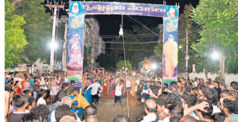
మహబూబ్ నగర్లో నిర్వహించిన కృష్ణాష్టమి వేడుకల్లో ఉట్ల కొడుకున్న యువకులు