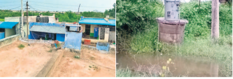
వినోదిపల్లి ముంపు గ్రామం, ఊరి చివర ఉన్న విద్యుత్ సింగిల్ పోస్ట్ ప్రాన్స్ పార్టర్ల వద్దకు చేసిన వరద

ముంపు గ్రామం సమీపంలోని ఎర్రగట్టు ప్రాంతంలో పునరావాస కేంద్రం ఏర్పాటు కోసం స్థలాన్ని సేకరించారు. 300 మందిదాకా నిర్వాసితులకు పట్టణం పట్టణం పంపిణీ చేశారు. ఇంకా కొందరికి పట్టణం అందాల్సి ఉన్నది. రోడ్లు, డ్రైనేజీ, అరకొర తాగునీటి వసతి, విద్యుత్ సౌకర్యం అయితే అవసరమైన సౌకర్యాలు కేంద్రంలో ఏర్పాటు కాలేదు. ఈ క్రమంలో తాము అక్కడికి వెళ్లి ఎలా ఉండాలని నిర్వాసితులు ప్రశ్నిస్తున్నారు. రైతులు కోరుతున్న ఇది.. ఎలాంటి ప్రయోజనాలు లేని వినోదిపల్లి రిజర్వాయర్ను రద్దు చేసి భూసేకరణ చేసిన పాలాలపై తమకు హక్కులు కల్పించాలని ఆయా గ్రామాల నిర్వాసితుల రైతులు మొరపెట్టుకుంటున్నారు. ఆంధ్రా ప్రాంతానికి నీటిని తరలించడానికి ఉమ్మడి రాష్ట్ర పాలకులు రూపొందించిన రిజర్వాయర్లో తప్పిడి ఉపయోగం లేదంటున్నారు. ఈ నిర్మాణం కోసం తాము ఎందుకూ పాటాటం చేస్తున్న విషయాన్ని వారు గుర్తు చేశారు. ఆదివేదికంగా ఎండ్రా కేంద్రం తాము సస్యపరిహారం కాకుండా తాజాగా ఇప్పటి రిజర్వాయర్ నిర్మాణాలకు ఇస్తున్న ప్యాకేజీని తమకు అమలు చేస్తే ఉపయోగకరంగా ఉంటుందని కోరుతున్నారు. వెండింగ్ సైతం సైతం ఇంకా రావాల్సి ఉందని నిర్వాసితులు చెబుతున్నారు. ఈ విషయంలో ప్రభుత్వం స్పందించి అందరికీ ఆమోదయోగ్యమైన ప్యాకేజీని అందిస్తే తామంతా గ్రామం విడిచిపెట్టి వెళ్లమని నిర్వాసితులు ఖరాయిండా చెబుతున్నారు.