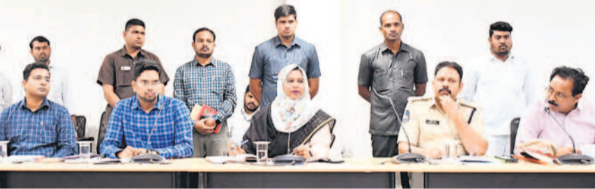
అధికారులతో సమీక్ష నిర్వహిస్తున్న జాతీయ మైనార్టీ కమిషన్ సభ్యులు సయ్యద్ షెహజాద్, పాల్గొన్న కలకత్తర్ల, ఎన్టీ

మైనార్టీ జాతీయ కమిషన్ సభ్యురాలు సయ్యద్ షెహజాద్