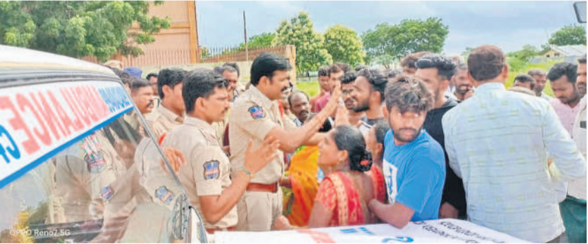
వడ్డేపల్లి : పోలీస్ స్టేషన్ సమీపంలో ఆందోళన చేస్తున్న మృతుడి కుటుంబసభ్యులు