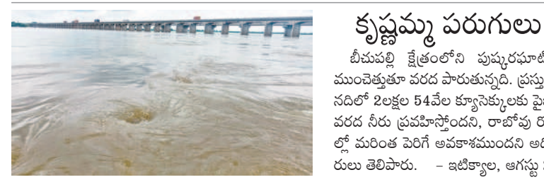
వినోదిపల్లిని తాకిన వరదనీరు