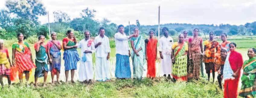
ఎమ్మెల్యే కవిత విడుదల కావడంతో హన్మంతుల మండలం కిష్టంపల్లిలో కూలీలకు స్వీట్లు పంచుతున్న టీఆర్ఎస్ నేతలు