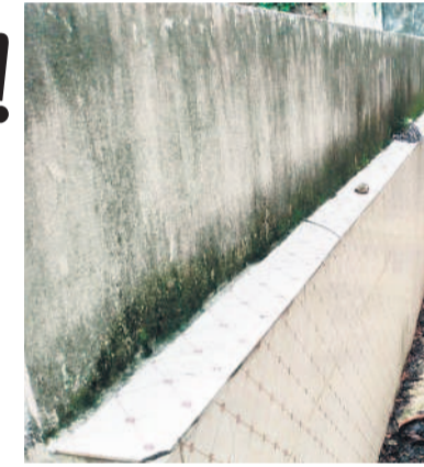
మహబూబ్ నగర్లో నీటి సౌకర్యం, పక్కనేక్షణ లేక అపరిశుభ్రంగా ఉన్న టాయిలెట్ ప్రాంతం

మహబూబ్ నగర్ మున్సిపాలిటీలో, ఆగస్టు 27 : కాంగ్రెస్ సర్కారు చేపట్టిన 'స్వచ్ఛదనం-పచ్చదనం' కార్యక్రమం కేవలం ప్రకటనలు, ప్రచార ఆర్కాటాలతో సరిపోయింది. కానీ ఆచరణలో మాత్రం సాధ్యం కావడం.. పరిసరాల పరిశుభ్రత మనందరి కర్తవ్యం.. ప్రతిఒక్కరూ వ్యక్తిగత పరిశుభ్రత పాటించాలి.. ఎట్టి పరిస్థితుల్లోనూ బహిరంగ మలమూత విసర్జనను ఉపేక్షించేది లేదు.. అంటూ నిత్యం ప్రజలకు అధికారులు సూచిస్తున్నారు. కానీ వారు విధులు నిర్వహించే చోట్లే అపరిశుభ్రత రాజ్యమేలుతున్నది. ప్రజల నుంచి వివిధ రకాలైన పన్నులు సూచించేయడంపై ఉన్న ధ్యాస.. కార్యాలయానికి వచ్చే వారికి మౌలిక సౌకర్యం కల్పించకపోవడం కర్తవ్యం.. ప్రతిఒక్కరూ వ్యక్తిగత పరిశుభ్రత పాటించాలి.. ఎట్టి పరిస్థితుల్లోనూ బహిరంగ మలమూత విసర్జనను ఉపేక్షించేది లేదు.. అంటూ నిత్యం ప్రజలకు అధికారులు సూచిస్తున్నారు. కానీ వారు విధులు నిర్వహించే చోట్లే అపరిశుభ్రత రాజ్యమేలుతున్నది. ప్రజల నుంచి వివిధ రకాలైన పన్నులు సూచించేయడంపై ఉన్న ధ్యాస.. కార్యాలయానికి వచ్చే వారికి మౌలిక సౌకర్యం కల్పించకపోవడం కర్తవ్యం.. ప్రతిఒక్కరూ వ్యక్తిగత పరిశుభ్రత పాటించాలి.. ఎట్టి పరిస్థితుల్లోనూ బహిరంగ మలమూత విసర్జనను ఉపేక్షించేది లేదు.. అంటూ నిత్యం ప్రజలకు అధికారులు సూచిస్తున్నారు.