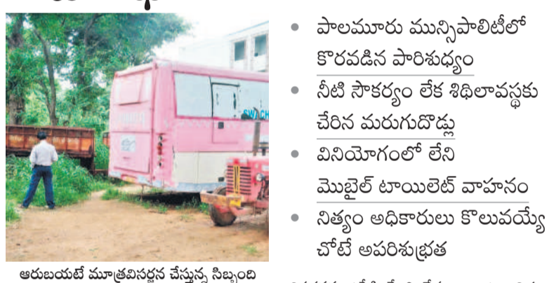
ఆరుబయటే మూత్రవిసర్జన చేస్తున్న నిబ్బంది

మహబూబ్ నగర్ మున్సిపాలిటీలో, ఆగస్టు 27 : కాంగ్రెస్ సర్కారు చేపట్టిన 'స్వచ్ఛదనం-పచ్చదనం' కార్యక్రమం కేవలం ప్రకటనలు, ప్రచార ఆర్కాటాలతో సరిపోయింది. కానీ ఆచరణలో మాత్రం సాధ్యం కావడం.. పరిసరాల పరిశుభ్రత మనందరి కర్తవ్యం.. ప్రతిఒక్కరూ వ్యక్తిగత పరిశుభ్రత పాటించాలి.. ఎట్టి పరిస్థితుల్లోనూ బహిరంగ మలమూత విసర్జనను ఉపేక్షించేది లేదు.. అంటూ నిత్యం ప్రజలకు అధికారులు సూచిస్తున్నారు. కానీ వారు విధులు నిర్వహించే చోట్లే అపరిశుభ్రత రాజ్యమేలుతున్నది. ప్రజల నుంచి వివిధ రకాలైన పన్నులు సూచించేయడంపై ఉన్న ధ్యాస.. కార్యాలయానికి వచ్చే వారికి మౌలిక సౌకర్యం కల్పించకపోవడం కర్తవ్యం.. ప్రతిఒక్కరూ వ్యక్తిగత పరిశుభ్రత పాటించాలి.. ఎట్టి పరిస్థితుల్లోనూ బహిరంగ మలమూత విసర్జనను ఉపేక్షించేది లేదు.. అంటూ నిత్యం ప్రజలకు అధికారులు సూచిస్తున్నారు. కానీ వారు విధులు నిర్వహించే చోట్లే అపరిశుభ్రత రాజ్యమేలుతున్నది. ప్రజల నుంచి వివిధ రకాలైన పన్నులు సూచించేయడంపై ఉన్న ధ్యాస.. కార్యాలయానికి వచ్చే వారికి మౌలిక సౌకర్యం కల్పించకపోవడం కర్తవ్యం.. ప్రతిఒక్కరూ వ్యక్తిగత పరిశుభ్రత పాటించాలి.. ఎట్టి పరిస్థితుల్లోనూ బహిరంగ మలమూత విసర్జనను ఉపేక్షించేది లేదు.. అంటూ నిత్యం ప్రజలకు అధికారులు సూచిస్తున్నారు.