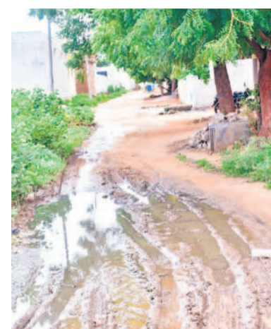
గద్వాల మండలంలో అధ్యానంగా డ్రైనేజీ వ్యవస్థ

చేయాలి వస్తున్నదని కార్యదర్శులు వాపోతున్నారు. ప్రత్యేకాధికారులు ఉన్నా ఫలితం శూన్యం.. సర్పంచరుల పదవీకాలం ముగియడంతో రెండు మూడు గ్రామ పంచాయతీలకు కలిపి ఒక ప్రత్యేకాధికారిని నియమించారు. అయితే, వారు ఏనాడూ గ్రామాల్లో పర్యటించి సమస్యలు తెలుసుకున్న దాఖలాలు లేవు. దీంతో వారి పట్ల ఎలాంటి ప్రయోజనం లేదు. ఇక భారమంతా పంచాయతీ కార్యదర్శులపై మోపడంతోపాటు నిధులు లేకపోవడంతో వారు కూడా చేతులెత్తేశారు. ప్రస్తుతం వర్షాలు కురుస్తుండడంతో రోడ్డుపై మురుగునీరు వచ్చి చేరుతున్నది. డ్రైనేజీలు కూడా శుభ్రం చేయకపోవడంతో ప్రజలు రోగం బారిన పడుతున్నారు. ఇప్పటికైనా అధికారులు స్పందించి గ్రామాల్లో పారిశుధ్య పనులు చేపట్టాలని ప్రజలు కోరుతున్నారు.