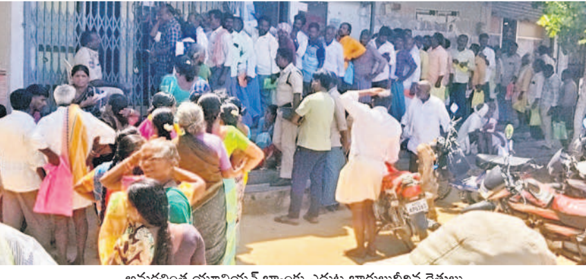
అమరవంత యూనియన్ బ్యాంకు ఎదుట కారులుబిలిన రైతులు