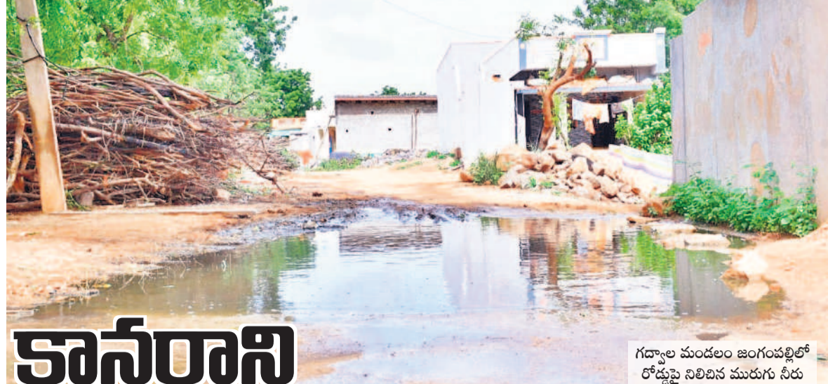
గద్వాల మండలం జంగంపల్లిలో రోడ్డుపై నిలిచిన మురుగు నీరు

తెరువకోవడంతో అమరవంత మండల కేంద్రంలోని యూనియన్ బ్యాంకుకు, వ్యవసాయ కార్యాలయానికి మంగళవారం రైతులు భారీగా తరలివచ్చారు. తమకు ఎందుకు లబ్ధి చేకూరలేదో సమాధానం చెప్పవరకు ఎండను కూడా కదా. వర్షాన్ని సైతం లెక్కచేయమని అన్నాడతలు ఆవేదన వ్యక్తం చేస్తున్నారు. ప్రభుత్వం రుణమాఫీ ప్రకటించి 40 రోజులు గడిచినా.. ఇంకా డబ్బులు జమ కావడం లేదని, ఒక్క అమరవంత మండలంలోనే వేల సంఖ్యలో బాధితులు ఉన్నారన్నారు. ఇప్పటికైనా ఎలాంటి పరతులు లేకుండా మాఫీ చేయాలని కోరుతున్నారు. కాగా, మంగళవారం బ్యాంకు అధికారులు పోలీసుల బందోబస్తు మధ్య విదులు నిర్వహించారు.