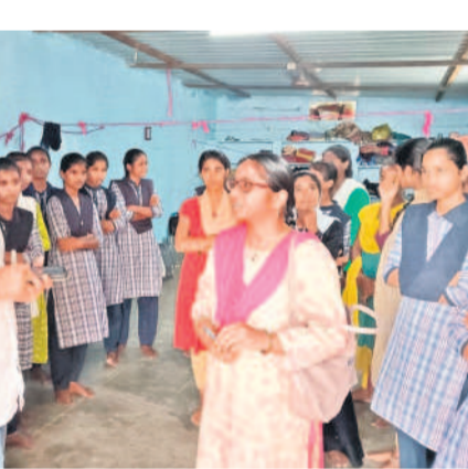
హాస్టల్లో బాలికలతో మాట్లాడుతున్న తానీల్దార్