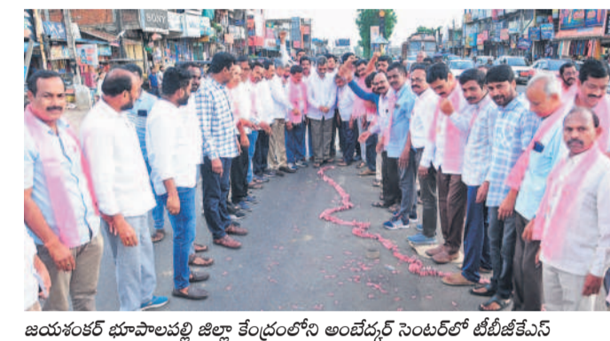
జయశంకర్ భూపాలపల్లి జిల్లా కేంద్రంలోని అంబేద్కర్ సెంటర్ లో బీజేపీ కేసీఆర్ ఆధ్వర్యంలో పటాకులు కాల్చి సంబురాలు జరుపుకుంటున్న నాయకులు