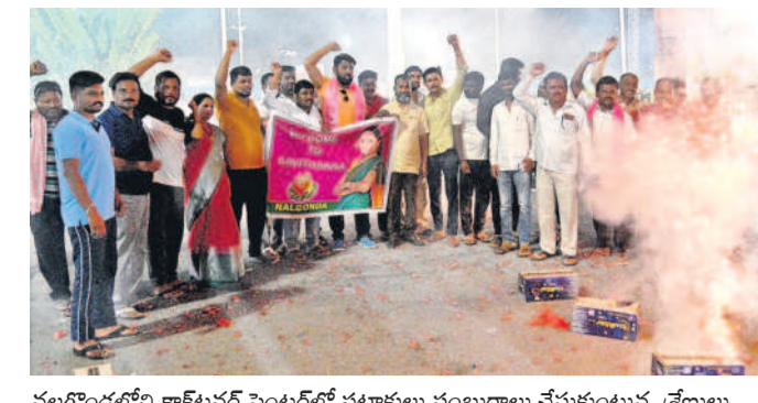
నల్లగొండలోని క్లాటర్లో సెంటర్ లో పటాకులు సంబురాలు చేసుకుంటున్న శ్రేణులు