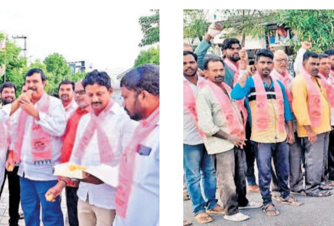
ఖమ్మంలోని బీఆర్ఎస్ జిల్లా కార్యాలయంలో స్వీటు తినిపించుకుంటున్న నాయకులు. చిత్రంలో మాజీ ఎమ్మెల్యే సందేష్ వెంకటేశ్వర్లు, సీనియర్ నేత అల్లసాని కృష్ణ శర్మ తదితరులు