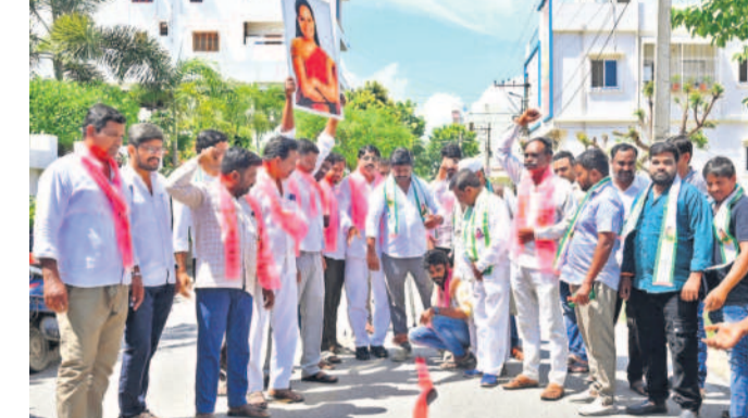
నిజామాబాద్ నగరంలోని ఎమ్మెల్యే కల్వకుంట్ల కవిత కార్యాలయం ఎదుట భారత జాగృతి ఆధ్వర్యంలో సంబురాలు జరుపుకుంటున్న నాయకులు