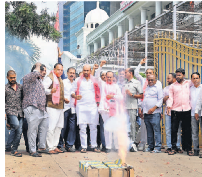
తెలంగాణ భవన్ వద్ద పటాకులు కాల్చి జై తెలంగాణ నినాదాలు చేస్తున్న మాజీ ఉప ముఖ్యమంత్రి మహమూద్ అలీ, బీఆర్ఎస్ నేతలు