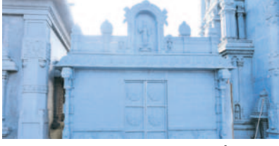
కొండపైన దక్షిణాప వక్కన నిర్మించిన డోనర్ సెల్

యాదగిరిగుట్ట, ఆగస్టు 26 : యాదగిరిగుట్ట కొండ పైన డోనర్ సెల్ను ఆలయ అధికారులు ఆధ్యాత్మికత ఉట్టిపడేలా ప్రత్యేకంగా నిర్మించారు. మాధవీదుర్లోకి లిప్తు, రథశాల మధ్యలో సుమారుగా 300 ఎన్.ఎం.టిలో దాతలు అందజేసే సహాయాన్ని స్వీకరించేందుకు ప్రత్యేక హాల్ నిర్మించారు. గతంలో పశ్చిమ రాజగోపురం వక్కనే ఆష్టభుజి ప్రాకార మండపంలో తాత్కాలికంగా ఏర్పాటు చేయగా దాతలకు కనిపించకుండా ఉండటంతో పాటు సరిపడా స్థలం లేకుండా ఉంది. ఈ పరిస్థితిని గమనించిన దేవస్థాన అధికారులు మాధవీదుర్లో భక్తులకు కనిపించే విధంగా విశాలమైన హాల్ను నిర్మించగా అందుబాటులోకి రానుంది. పై భాగంలో స్వామివారి ప్రతిమతోపాటు