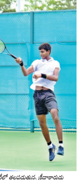
పోటీలో తలపడుతున్న క్రీడాకారుడు

భువనగిరి కలెక్టరేట్, ఆగస్టు 26 : భువనగిరి జిల్లా కేంద్రంలోని స్కూల్ డ్రెమెన్స్ టెన్నిస్ అకాడమీలో రాజా సరసింహారావు మెమోరియల్ ఐటీఎఫ్ పరల్ల టెన్నిస్ టూర్నామెంట్ 18 టెన్నిస్ పోటీలు సోమవారం హోరాహోరిగా కొనసాగాయి. ఉదయం బాల బాలికల విభాగాల్లో సింగిల్స్ క్వాలిఫైయింగ్ మ్యాచ్లు జరుగగా, మధ్యాహ్నం తర్వాత మెయిన్ డ్రాస్ ఫస్ట్ రౌండ్ కొనసాగింది. మంగళవారం మెయిన్ డ్రాస్ ఫస్ట్ రౌండ్ ప్రారంభం కానుంది. వచ్చే నెల ఒకటో తేదీ వరకు ఈ పోటీలు జరుగుతున్నాయి.