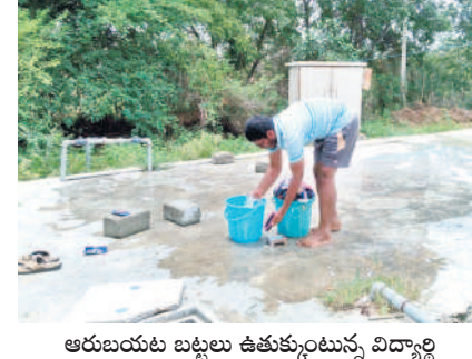
ఆరుబయట బట్టలు ఉతుకుంటున్న విద్యార్థి

నయాపైసా రాలే.. ఈ ఏడాది 2024-25 విద్యా సంవత్సరానికి రాష్ట్ర ప్రభుత్వం రూ.11.74 కోట్లు.. ఇవి వేతనాలకు మాత్రమే విడుదల చేసింది. రాష్ట్రవ్యాప్తంగా అన్ని విశ్వవిద్యాలయాల అభివృద్ధికి రూ.500 కోట్లు కేటాయించినా.. అందులో పాలమూరు వర్సెటికి ఇప్పటి వరకు ఒక్కరూపాయి కూడా అందలేదు. కేంద్ర ప్రభుత్వం సైతం పీఎం ఉపాధి కార్యక్రమం రూ.100 కోట్లు మంజూరు చేసినా.. అవినీటి కారణాలతో పరిమితమయ్యాయి. ఇప్పటికైనా నిధులు విడుదల చేయాలని విద్యార్థులు కోరుతున్నారు.