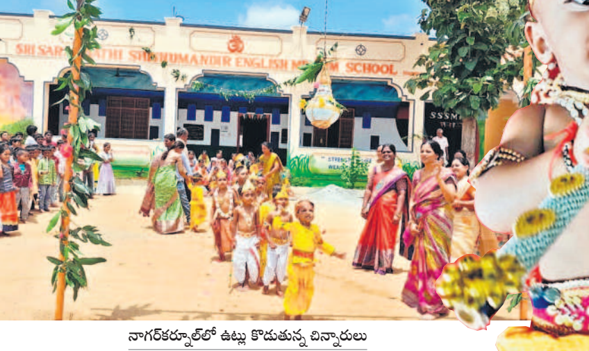
నాగర్ కర్నూల్లో ఉట్ట కొడుకున్న చిన్నారులు

• వైభవంగా గోకులాష్టమి • కృష్ణుడు, గోపికల వేషధారణలో చిన్నారులు • కిటికీలులాడిన ఇన్స్టాన్ ఆలయాలు • ఉత్సాహంగా.. ఉట్ట వేడుక 'గోకుల కృష్ణ.. గోపాల కృష్ణ మాయలు చాలయ్యాయి.. మా కన్నులలో దీపాలు వెలిగి పండుగ తేవయ్యాయి..' 'జయ జనార్దన.. క్రీష్ణ రాధికా వతే. జన విమోచనా క్రీష్ణ జన్మ మోచనా.. 'ముకుందా.. ముకుందా.. క్రీష్ణ ముకుందా.. ముకుందా.. అన్న పాటలు హారిత్రాయి. సోమవారం శ్రీకృష్ణ జన్మాష్టమి వేడుకలు ఉమ్మడి జిల్లా వ్యాప్తంగా వైభవంగా జరిగాయి. నెత్తిన నెమలి పింఛం.. చేతిలో విల్వనగ్రోపి.. మోమున విరుమందహాసంతో నల్లనయ్య గోపికలతో కలిసి విహారించడంతో ఇలా బృందావనంలా మారింది. ఇన్స్టాన్ ఆలయాలను సుందరంగా ముస్తాబు చేయగా.. గోవర్ధన గిరిధారికి భక్తిశ్రద్ధలతో భక్తులు పూజలు నిర్వహించారు. కన్నయ్య, గోపికల వేషధారణలో చిన్నారులు ముద్దులొలికించగా చూసి వారి తల్లిదండ్రులు మురిసిపోయారు. సాయంత్రం పలు ప్రాంతాల్లో ఉట్ట వేడుక సంబురంగా సాగింది. చిన్నారులు, యువకులు ఉట్ట కొట్టెందుకు పోటీపడగా.. ప్రజలు ఉత్సాహ పరిచారు. - నెల్సన్ రెడ్డి మహబూబ్ నగర్, ఆగస్టు 26