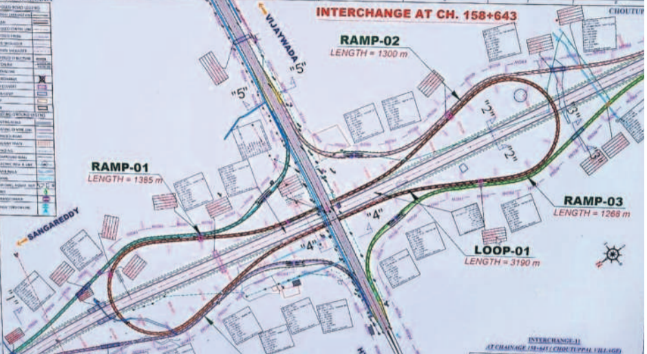
చౌటుప్పల్ డబుల్ డెండర్ జంక్షన్ ప్రాంతం

రిజనల్ లింగ్ రోడ్డు పనుల్లో భాగంగా ఇప్పటికే చౌటుప్పల్ రెవెన్యూ డివిజన్ పరిధిలోని పటిగొండ, చౌటుప్పల్ మండలాలలో రైతుల అవార్డు ఎంకైర్డ్ పూర్తయింది. నోటిఫికేషన్లు జారీ చేసి పరిశీలన చేయించేందుకు ప్రభుత్వం సిద్ధంగా ఉంది. చౌటుప్పల్ జంక్షన్ నీకు సంబంధించి భూ సేకరణ పేగ్గొంగి కూడా పూర్తయింది. మరో మూడో జంక్షన్ సంబంధిత సర్వే సంబంధ కూడా ఇవ్వాలి వ్వారు. కాగా, గతంలో జంక్షన్ కు 78 ఎకరాలు ప్రతిపాదించగా.. రెండోసారి డిజైన్ మార్చి 181 ఎకరాలు అవసరమని నిర్ణయించారు. ఈ మేరకు చౌటుప్పల్ లో 163 ఎకరాలు, తం గడ