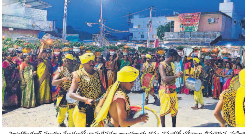
మోటకొండూరు మండల కేంద్రంలో గ్రామదేవతల ఆలయాలకు దప్ప చప్పుళ్లతో బోనాలు తీసుకెళ్లిన మహిళలు.

జిల్లాలో పలుచోట్ల ఆదివారం బోనాల పండుగను నిర్వహించారు. దప్ప చప్పుళ్లు, పోతరాజుల విన్యాసాల పండ్లు మహిళలు బోనాలు తీసుకెళ్లి అమ్మవారికి మొక్కులు చెల్లించుకున్నారు. మోటకొండూరు, భువనగిరి, వలిగొండ, రాజాపేట, యాదగిరి గుట్ట మండలంలోని వంగపల్లిలో జరిగిన బోనాలతో స్థానికంగా ఆధ్యాత్మిక సందడి నెలకొంది.