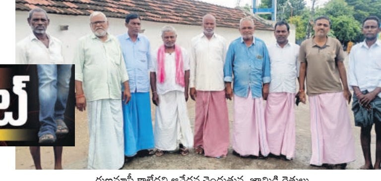
రుణమాఫీ కాలేదని ఆవేదన చెందుతున్న జామిద్ రైతులు

నాకు రేషన్ కార్డు ఉన్న రుణమాఫీ కాలే. నేను సొసైటీలో రూ.1.20 లక్షల రుణం తీసుకున్నా. ఇక రెండో లిస్ట్ లో పేరు వస్తుందని ఆశగా ఉన్నాను. రాకపోయేనేరకే మాడో లిస్ట్ లో వస్తుందని చెప్పింది. ఇప్పుడు మాడో లిస్ట్ అయిపోయింది. మరి నా బాకీ మాఫీ అయితే కాదో తెలుస్తుంది. తెలిసిన సార్లు అడిగితే అయితడని అంటుంది. మరి నాలుగో లిస్ట్ లో నా పేరు వస్తుందో లేదో బాకీ మాఫీ అవుతుందో కాదో ఏం తెలుస్తుంది.