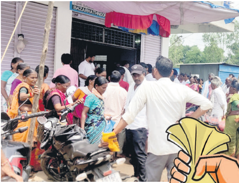
బ్యాంకు వద్ద రుణమాఫీ గురించి తెలుసుకునేందుకు గుమిగూడిన రైతులు

భైంసా, ఆగస్టు 25 : గడ్డెన్నవారు ప్రాజెక్టు రైతాంగానికి ఊరట లభించింది. ఎమ్మెల్యే రామారావు పటిల్ అన్నారు. ఆదివారం విలేజరులతో మాట్లాడుతూ.. గడ్డెన్నవారు ప్రాజెక్టు కెపాసిటీ 358.7 మీటర్లు కాగా ప్రాజెక్టులో 357.5 మీటర్ల నీటి నిల్వ ఉంటేనే 2017 జీవో ప్రకారం సాగు నీరు విడుదల అవుతుంది. ఈ విషయాన్ని ముఖ్యమంత్రి రేవంత్ రెడ్డి, సాగునీటి శాఖ మంత్రి ఉత్తం కుమార్ రెడ్డి దృష్టికి తీసుకవెళ్లడంతో ప్రభుత్వం 355.9 మీటర్ల వరకు నీరు ఉన్నప్పటికీ సాగునీరు వాడుకోవచ్చని జీవో విడుదల చేసింది. దీంతో 0.6 టీఎంసీల నీరు అదనంగా వాడుకోవడం వల్ల 6 వేల ఎకరాలకు సాగునీరు అందడంతో మొత్తం 14 వేల ఎకరాలకు పూర్తి స్థాయిలో ప్రయోజనం చేకూరుతుందన్నారు. అంతేకాకుండా ఈ జీవో విడుదల వల్ల ప్రాజెక్టు ఎగువ భాగంలో లిఫ్ట్ ఇరిగేషన్ ద్వారా కుటీర్ మండల రైతులకు సాగు నీరు అందుతుందన్నారు. ఈ విలేజరుల సమావేశంలో తానూర్ మండల శాఖ అధ్యక్షుడు చిన్నారెడ్డి, రాష్ట్ర కార్యదర్శన పట్టుల గోపాల్ సర్దా, కౌన్సిలర్ కపిల్, నాయకులు కృష్ణ పాల్గొన్నారు.