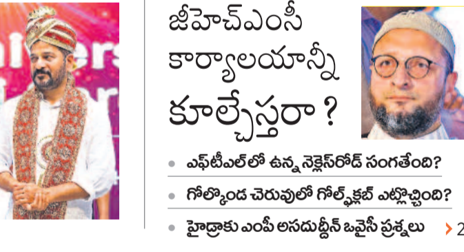
జీహెచ్ఎంసీ కార్యాలయాన్ని కూల్చివేస్తారా? ఎఫ్ టీఎల్లో ఉన్న నెక్సెస్ రోడ్ సంగతేమిటి? గోల్కొండ చెరువులో గోల్కొండ ఎల్సీబి నిర్మాణం? హైద్రాబాద్ ఎంపీ అసదుద్దీన్ షిఖ్వీ ప్రశ్నలు >2