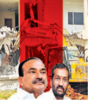
హైదరాబాద్, ఆగస్టు 25 (నమస్తే తెలంగాణ): హైదరాబాద్ లో హైద్రా కుల్చివేతలపై బీజేపీలో అంతర్యుద్ధం నెలకొంది. సఖ్యతగా ఉండే ఇద్దరు ఎంపీల మధ్య ఇది విభేదాలకు కారణమైంది. ప్రముఖ నేతలను అక్కినేని నాగార్జునుడు చెందిన ఎన్ కన్స్ట్రక్షన్స్ సహా కూల్చివేతలపై వారు చర్యలకు విరుద్ధంగా చేస్తున్న వ్యాఖ్యలు బీజేపీలోని అంతర్యుద్ధాన్ని కండ్లకు కడుతున్నాయి. కేంద్రమంత్రి పర్సాద్ పోలిసిద్ధం వ్యాఖ్యలపై కిష్కెరెడ్డి, బండీ సంజయ్ మధ్య ఇప్పటికే విభేదాలు పొడవవుతున్నాయి. ఇప్పుడు ఎంపీలు ఈటల రాజేందర్, రఘునందన్ రావు ఆ జాబితాలో చేరారు. వీరిద్దరి మధ్య సఖ్యత ఉన్నట్లు బయటకు కనిపిస్తున్నట్టు బీజేపీ వారి వైఖరి మాత్రం >2వ పేజీలో