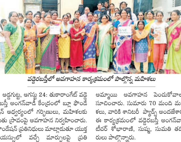
వడ్డేరబస్స్ లో అవగాహన కార్యక్రమంలో పాల్గొన్న మహిళలు

అడ్డగుట్ట, ఆగస్టు 24: తురారాంగ్ వద్ద రబస్స్ అంగనవాడి కేంద్రంలో ట్రాఫిక్ పోలీస్ అడ్డగుట్టలో గర్భిణులు, మహిళలకు రుతు ప్రావంపై అవగాహన నిర్వహించారు.