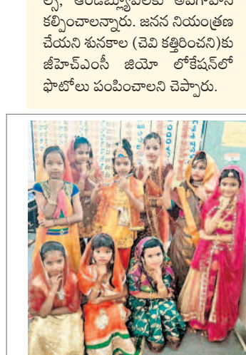
ధూమపాని ప్రాథమిక పాఠశాలలో వేడుకల్లో పాల్గొన్న బిచ్చుకులు