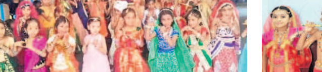
మేకపండు ప్రాథమిక స్కూల్ పాఠశాలలో బిచ్చుకులు వేడుకలు