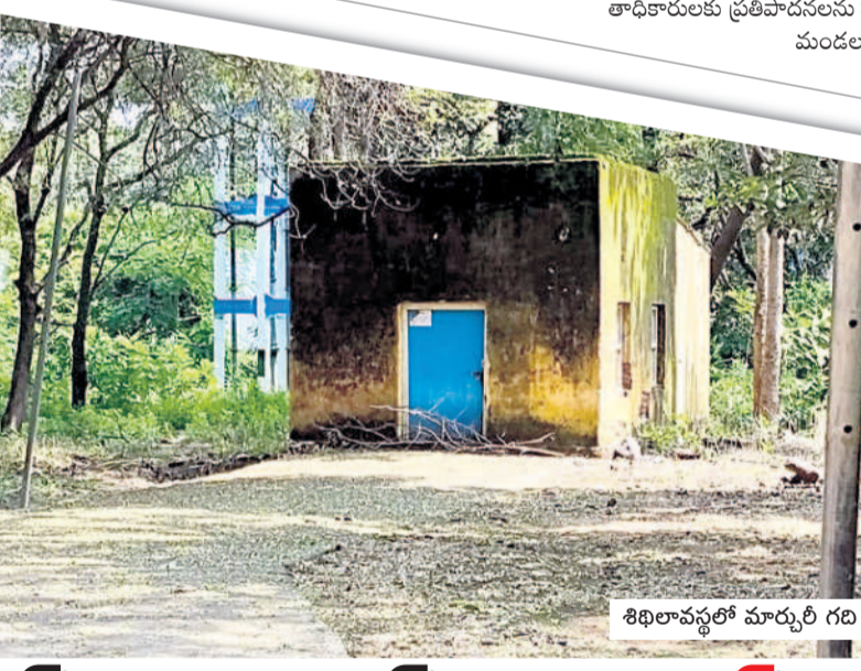
శిథిలావస్థలో మార్చురీ గది