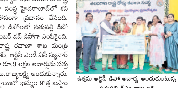
ఉత్తమ ఆర్టీసీ డిపో అవార్డు అందుకుంటున్న సత్పుల్లి డిపో అధ్యక్షుడు