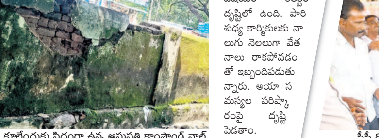
కాలేందుకు సిద్ధంగా ఉన్న ఆసుపత్రి కాంపౌండ్ వాట్

మండల కేంద్రానికి వచ్చే ప్రజలు, ఆసుపత్రికి వచ్చే రోగుల సౌకర్యాల బలోపేతం కోసం ఆసుపత్రి ఆవరణలో పబ్లిక్ టాయిలెట్స్ నిర్మించారు. బోయ్ సౌకర్యం కల్పించారు. అయితే ఇప్పటివరకు వాటర్ కనెక్షన్ ఇవ్వలేదు. దీంతో