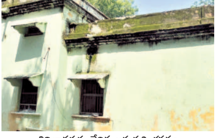
శిథిలావస్థకు చేరిన ఆసుపత్రి భవనం

గత కేసీఆర్ పభుత్వ హయాంలో పినపాక ఎమ్మెల్యేగా ఉన్న డి. శిథిలావస్థకు చేరిన ఆసుపత్రి భవన నిర్మాణానికి ప్రతిపాదనలు పంపించారు. దీంతో అప్పటి ప్రభుత్వం రూ.2.70 కోట్లు మంజూరు చేసింది. పూర్తిస్థాయిలో వైద్యం అందించేందుకు 8 మంది వైద్యులను సైతం నియమించింది. అయితే కాంగ్రెస్ ప్రభుత్వం వచ్చిన తర్వాత నూతన ఆసుపత్రి భవన నిర్మాణ ప్రతిపాదనకు, టెండర్ల ప్రక్రియకు బ్రేక్ పడింది. 8 నెలలు గడుస్తున్నా నిర్మాణ పనులు చేపట్టలేదు.