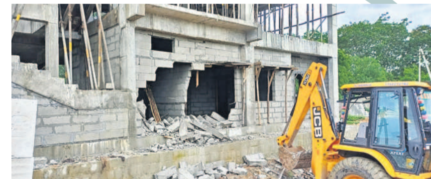
మొయినాబాద్ పంచాయతీ పరిధిలో అక్రమ నిర్మాణాలను జేసినవారి కోర్టువేయిస్తున్న అధికారులు