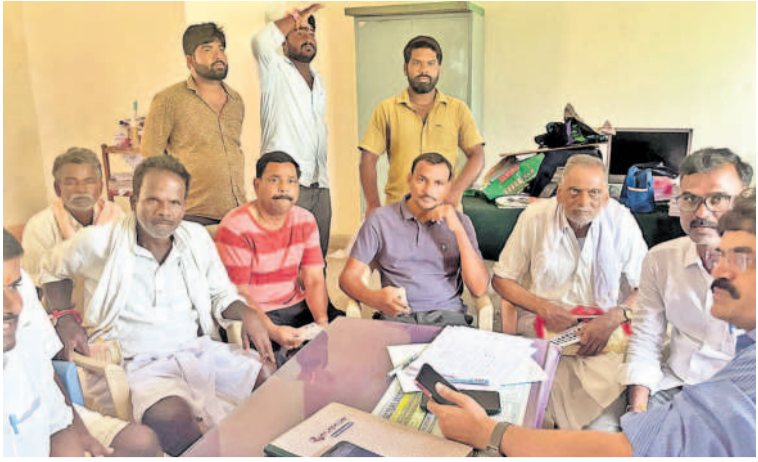
రుణమాఫీ ఎందుకు కాలేదని కొత్తూరు ఏవో గోపాలమ్మ అడుగుతున్న మండల రైతులు