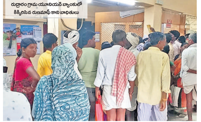
రుద్రారం గ్రామ యూనియన్ బ్యాంకులో కిక్కిరిసిన రుణమాఫీ కాలి బాధితులు