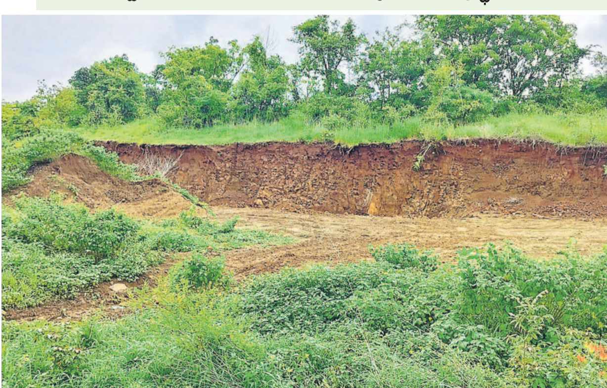
పట్టించుకోని అధికారులు.. ఆగ్రహం వ్యక్తం చేస్తున్న స్థానికులు