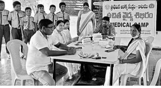
గంగారం మోడల్ స్కూల్లో వైద్య పరీక్షలు చేస్తున్న డాక్టర్లు