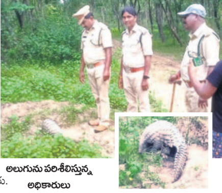
అలుగును పరిశీలిస్తున్న అధికారులు