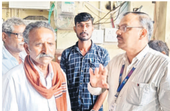
బ్యాంకులో విచారణ చేపడుతున్న రిజనల్ మేనేజర్ రిజితే