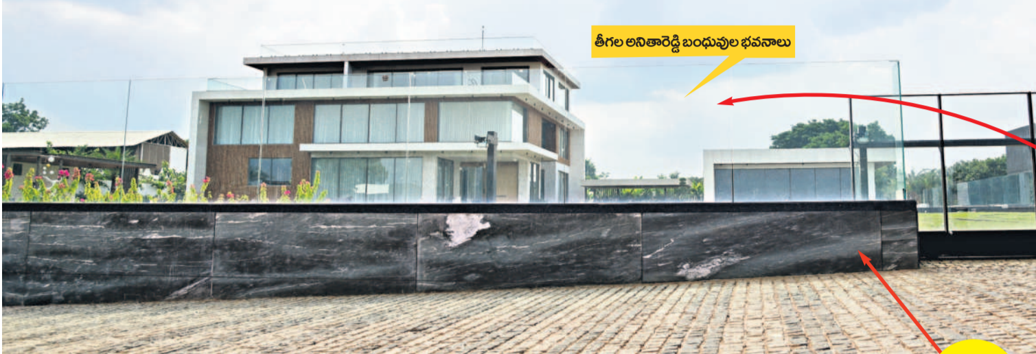
తీగల అనితారెడ్డి బంధువుల భవనాలు