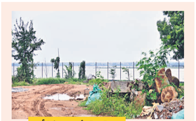
గ్రీన్ కో గ్రూపు ఎండ్ గెస్ట్ హౌస్ ఇది

గండిపేట జలాశయం ఎఫ్టీఎల్ పరిధిలో ఉందంటూ... తన పరిధిని దాటుకొని పోయి హైద్రా కూల్చివేసిన మూడు బహుళ అంతస్తుల నిర్మాణాలు ఇవే. ఈ కూల్చివేతలతోనే హైద్రా అడుగులపై అనుమానాలు వెల్లువెత్తుకున్నాయి. అప్పటికి రంగారెడ్డి పరిషత్ హైద్రా పరిధి అని జీవో నెంబరు 99లో స్పష్టంగా ఉన్నప్పటికీ... అప్పటికి దాటి 15 కిలోమీటర్ల దూరంలోని అప్పారావుగూడలో ఉన్న ఈ నిర్మాణాలను హైద్రా యంత్రాంగం భారీ క్రేన్లు, పాల్లెయిన్లతో పచ్చి నేల మట్టం చేసింది. హైద్రా జీవోలో ఎక్స్టెండ్డ్ యూఎల్ఐ, జీపీ జాబితాలో కూడా అప్పారావుగూడ లేదు. నోటీసులు ఇవ్వడం మాలు దేవుడెవరగు... కనీసం అందులో ఉన్న ఫర్మర్, ఇతర సామగ్రిని తీసుకునేందుకు కూడా సమయం ఇవ్వకుండా