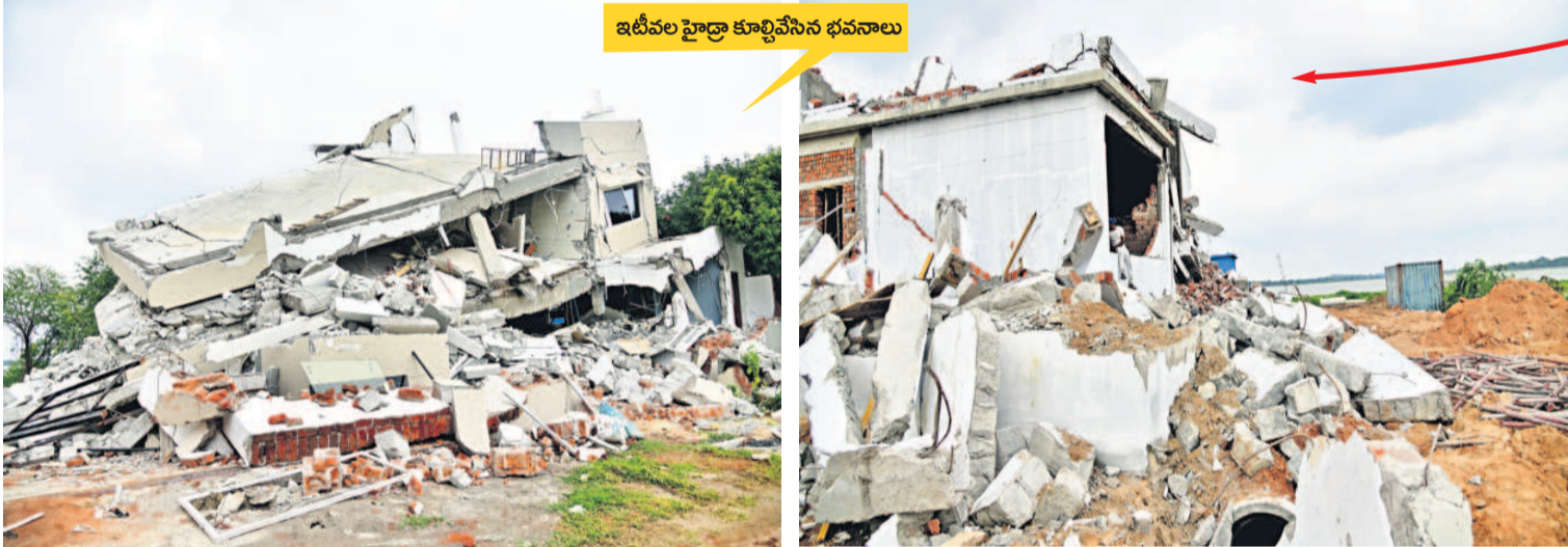
ఇటీవల హైద్రా కూల్చిన భవనాలు

క్షణాల్లో ఈ నిర్మాణాలను కూల్చివేశారు. అయితే క్షేత్రస్థాయికి వెళ్లి పరిశీలిస్తే... ఈ నిర్మాణాలు ఒక వెంచర్లో ఉన్నాయి. వెంచర్ ముఖ్య ద్వారం నుంచి లోపలికి వెళ్తూనే కుడివైపు గండిపేట చెంచనే భారీ నిర్మాణాలు (ఇప్పుడు కూల్చివేసిన నిర్మాణాలకు సమాంతరంగా) కొనసాగుతున్నాయి. హైద్రా యంత్రాంగం వాటి ముందుగానే కూల్చివేతలకు వెళ్లిందని అర్థమవుతుంది. ఇక హైద్రా కూల్చివేసిన మూడు నిర్మాణాల వెనక (మధ్యలో రోడ్డు) మరో భారీ నిర్మాణం రూపుదిద్దుకుంటున్నది. దీంతో ఆ నిర్మాణం ముందు నిలబడే హైద్రా