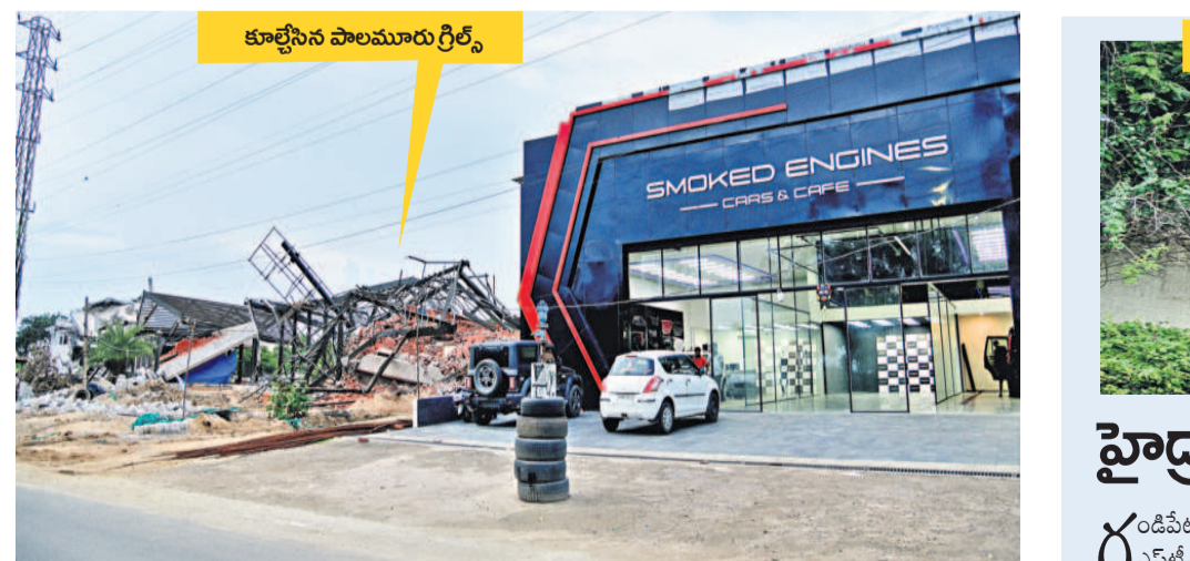
కూల్చిన పాలమూరు గ్రీత్స్

సాగర్ ఒడ్డున.. పంట పొలాల మధ్యలో రాజసాన్ని ఒలకబోసేలా నిర్మించిన ఈ ఫాం హౌస్ శాసనమండలి చైర్మన్ గుత్తా సుఖేందర్ రెడ్డిది. హిమాయత్ సాగర్ ఎఫ్టీఎల్ హద్దు రాయి సాక్షిగా ఈ భారీ నిర్మాణం రూపుదిద్దుకున్నది. నిబంధనల ప్రకారం ఎఫ్టీఎల్ పరిధిలో ఎలాంటి నిర్మాణాలు చేపట్టవద్దు. అయినప్పటికీ ఈ భారీ నిర్మాణాన్ని చేపట్టారు. అంతేకాదు... ఈ ఫాం హౌస్ గేటు ముందు ఉన్న భారీ ప్రదేశంలోనే ఫోటోగ్రఫీ గ్రానైట్ బండలతో సింపడాన్ని చూస్తే, ఈ భవనం ఎంత ఖరీదైందో అంచనా వేసుకోవచ్చు.