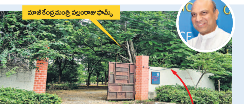
మాజీ కేంద్ర మంత్రి పల్లంరాజు ఫామ్స్

టీవల హైద్రా కూల్చివేసిన నిర్మాణం ఇది. గండిపేట జలాశయం ఎఫ్టీఎల్ పరిధిలో ఉన్నందున కూల్చినా తప్పని హైద్రా స్ట్రక్చరల్ ఇంజనీర్. మరీ... దానిని అనుకునే మరో నిర్మాణం ఉంది. అది ఎఫ్టీఎల్ పరిధిలోకి రాదా? అనేది సామాన్యుడి సందేహం. ఒకవేళ కూల్చివేయని నిర్మాణం పక్కనుంచే ఎఫ్టీఎల్ గీత వెళ్లిందనే సాకు చూపే అవకాశాలు ఉండొచ్చు. అదే నిజమైతే... ఎఫ్టీఎల్ ను అనుకొని వంద ఫీట్ల వరకు బఫర్ జోన్ ఉంటుంది. బఫర్ జోన్ ను కాపాడాల్సింది కూడా అదే హైద్రా కదా! కానీ ప్రత్యేకంగా ఓ నిర్మాణాన్ని కూల్చడం.. మరో నిర్మాణాన్ని కూల్చకుండా వదిలేయడం అనేది ప్రస్తుతం చర్చనీయాంశంగా మారింది.