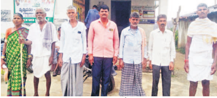
సిద్దిపేట జిల్లా దుబ్బాక మండలం ఆరేపల్లిలో రుణమాఫీ కాలేదని ఆందోళన చెందుతున్న రైతులు