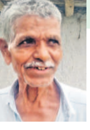
- చెట్ల సర్వోదయ, రైతు, ఆరేపల్లి

నాకు రెండేకరాల భూమి ఉన్నది. బ్యాంకులో రూ. 70 వేలు రుణం ఉంది. కాంగ్రెస్ ప్రభుత్వం రైతులకు రుణమాఫీ ప్రకటించినదానినే నాతోపాటు, తొలి విడతలో నాపేరు రావడం, మళ్లీ రెండో విడతలో మాకు, అందులో లేదు. ఇప్పుడు మాడో విడతలో కూడా రుణమాఫీ కాలేదు. మలాంలో చిన్న రైతులకు రుణమాఫీ చేయాలని, ఇదిమి సర్కారు ఆర్డర్ కావడం లేదు.