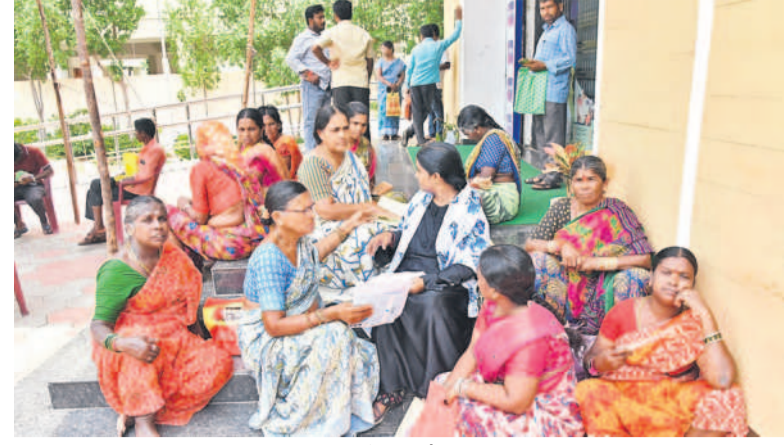
బుధవారం సిద్దిపేట జిల్లా కేంద్రంలోని ఎస్.బీ.ఎం.ఎ. కుటుంబ సంక్షేమ కార్యాలయంలో