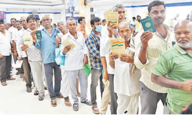
బుధవారం సిద్దిపేట జిల్లా కేంద్రంలోని ఎస్.బీ.ఎం.ఎ. వద్ద బారులు తీరడం రైతులు

ధర్మాలు చేపట్టుతున్నారని. మండల తహసీల్దార్, నియోజకవర్గ కేంద్రాల్లోని ఆర్డీవో కార్యాలయాలు ఎదుట ధర్మాలు చేపట్టాలని బీఆర్ఎస్ పార్టీ ప్రకటించింది. అందరి రుణాలను మాఫీ చేయాలని కోరారు. రైతులకు రుణమాఫీ అమలులోని లోపాలు సరిదిద్దాలి అధికారులకు స్పష్టత ఇవ్వాలి అని కోరారు.