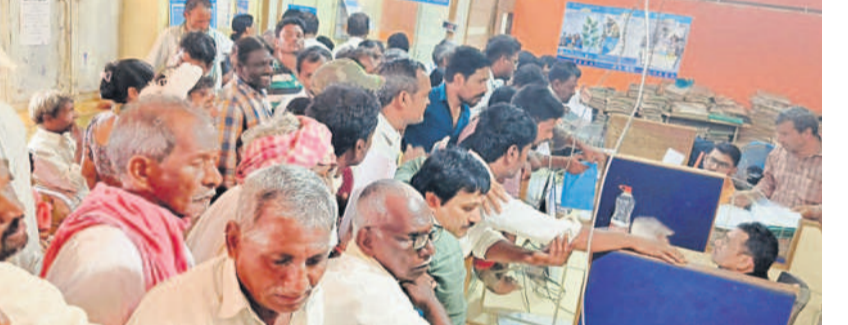
బుధవారం హద్దూర్లోని కెనరా బ్యాంకులో ఇబ్బందులు పడుతున్న రైతులు

న్యూట్ కల్, ఆగస్టు 21: రైతులందరికీ రూ. 2 లక్షల్లోపై పంట రుణాలు మాఫీ చేస్తామని కాంగ్రెస్ అధికారం చేపట్టిన తర్వాత కొరతలో సగం మంది రైతులకు రక్త హస్తం చూపుతున్నది. ఏ గ్రామానికీ వెళ్లకూ, ఏ రైతుకు పనిలేదనినా పంట రుణమాఫీ కాలేదని ఆవేదన వినిపిస్తున్నది. సంగారెడ్డి జిల్లా న్యూట్ కల్ మండలం హద్దూర్ కెనరా బ్యాంకు పరిధిలో రూ. 2.50 లక్షల పైనే ఉన్న డబ్బులు కట్టడానికి రైతులు అరుగుతున్నారు. అందరి రుణాలను మాఫీ చేయాలని కోరారు.