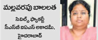
మల్లవరపు బాలలత నివెల్స్ స్పాకల్లి సీఎస్ఐ బిఎస్ఎస్ అకాడమీ, హైదరాబాద్

బార్ దీవుల్లోని గ్రేట్ అండమాన్, జార్వాన్, సెలెస్టిన్ తెగలు కూడా పర్వతం, రవాదారుల నిర్మాణం ఇతర అభివృద్ధి కార్యక్రమాల వల్ల ఆస్తిశాస్త్రాన్ని కోల్పోతున్నాయి. ఆదివాసీల హక్కుల పరిరక్షణ ఆదివాసీల హక్కుల పరిరక్షణకు దేశంలో అటవీ హక్కుల చట్టం-2006, డీసా చట్టం-1996, రాజ్యాంగంలోని అనేక అధికరణలు వారికి ప్రత్యేక హక్కులను కల్పిస్తున్నాయి. ఈశాన్య భారతంలో స్వయంప్రతిపత్తి కౌన్సిల్ ద్వారా స్థానిక ఆదివాసీ పరిపాలనకు ప్రత్యేక ఏర్పాట్లు జరిగాయి. డేబార్, షాషా సంఘాలు వారి అభివృద్ధి కోసం సూచనలన్నీ చేశాయి.