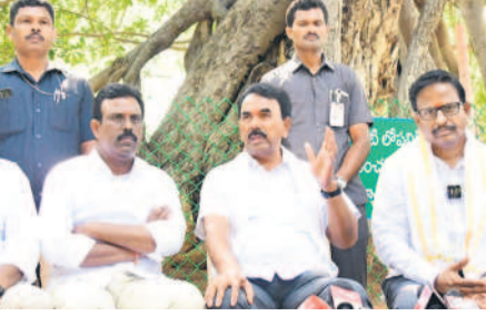
విలేకరుల సమావేశంలో మాట్లాడుతున్న మంత్రి జూపల్లి కృష్ణారావు

పాలమూరుకు రూ.5 కోట్లు మంజూరు. ప్రజల ఆరోపణలు ఉన్నప్పటికీ, బ్యాంక్ లోనే ఉన్నట్లు తెలుస్తోంది. ప్రభుత్వంపై ప్రజల ఆరోపణలు ఉన్నప్పటికీ, బ్యాంక్ లోనే ఉన్నట్లు తెలుస్తోంది.