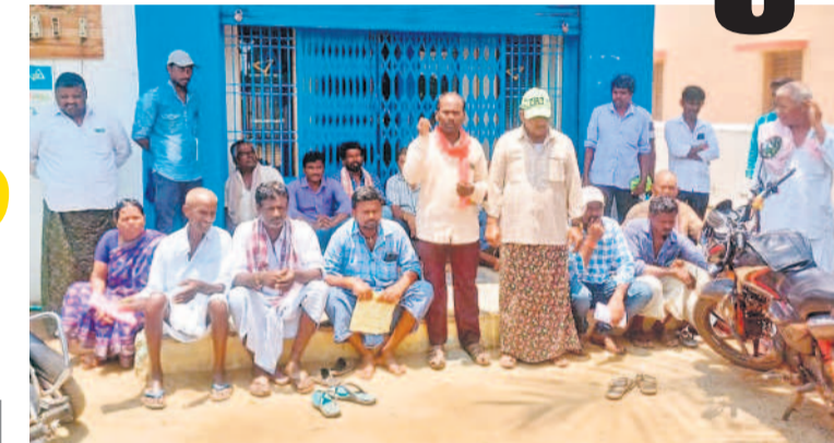
లింగనవాయి కెనరా బ్యాంక్ ఎదుట నిరసన తెలుపుతున్న రైతులు