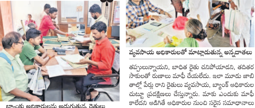
బ్యాంకు అధికారులను అడుగుతున్న రైతులు

వారికి కార్యాలయం, బ్యాంకుల చుట్టూ ప్రదర్శనలు. ప్రజల ఆరోపణలు ఉన్నప్పటికీ, బ్యాంక్ లోనే ఉన్నట్లు తెలుస్తోంది.