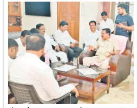
నేతలతో మాట్లాడుతున్న మాజీ మంత్రి నిరంజన్ రెడ్డి