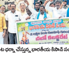
కలెక్టరేట్ ఎదుట ధర్మా చేస్తున్న భారతీయ కిసాన్ సంఘం నాయకులు

జగిత్యాల, ఆగస్టు 21: రైతులందరికీ పంట రుణ మాఫీ చేయాలని జిల్లా భారతీయ కిసాన్ సంఘం నాయకులు డిమాండ్ చేశారు.