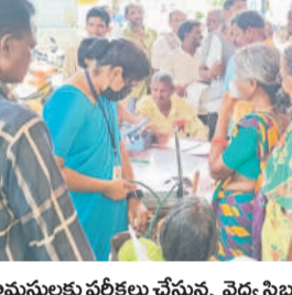
గ్రామస్థులకు వర్కింగ్ టీమ్ వైద్య శిబిరం

మొదటివేల రూరల్, ఆగస్టు 21: జగిత్యాల రూరల్ కమిటీ సభ్యులు ప్రతిమ దవాఖాన ఆధ్వర్యంలో వైద్య శిబిరం నిర్వహించారు.