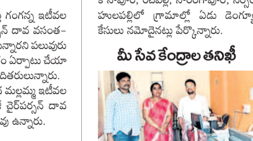
కోరుట్ల: పట్టణంలోని మీ సేవ కేంద్రాలను సమీక్షించారు