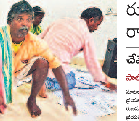
నిజామాబాద్ జిల్లా రుద్దూర్ లో రుణమాఫీ కాని రైతుల నుంచి తొలి, మలి బిడతలో స్వీకరించిన దరఖాస్తులను కార్యాలయంలో ఇలా వినిలపారేశారు. దీంతో తమ దరఖాస్తును వెతుక్కుంటున్న రైతులు. (ఇన్ సైట్ లో) దరఖాస్తు స్వీకరిస్తున్న నోడల్ అధికారి