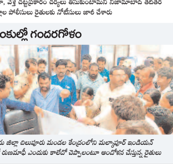
జనగామ జిల్లా బిలువూరు మండల కేంద్రంలోని మల్కాపూర్ ఇండియన్ బ్యాంకులో రుణమాఫీ ఎందుకు కాలేదో చెప్పాలంటూ ఆందోళన చేస్తున్న రైతులు