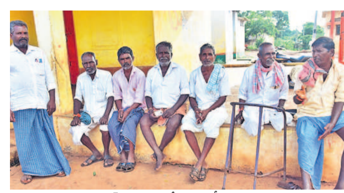
మదన్పల్లి గ్రామంలో రుణ మాఫీ కార్యక్రమం

వికారాబాద్, ఆగస్టు 20 : బ్యాంకుల్లో రుణాలు తీసుకున్న రైతులకు రుణ మాఫీ చేస్తామని ఎన్నికల ముందు కాంగ్రెస్ పార్టీ హామీ ఇచ్చింది. అధికారంలోకి వచ్చి ఎనిమిది నెలలు గడుస్తున్నా రుణ మాఫీ విషయంలో రైతులకు స్పష్టత రాలేదు. మొదటి విడతలో లక్షల్లో ఉన్న రైతులకు రుణ మాఫీ చేస్తామని చెప్పి చాలా మందికి చేయలేదు. రెండో విడతలో రూ. 1.50 లక్షల్లో ఉన్న వారికి మాఫీ చేస్తామని చెప్పినా.. అందులో కూడా చాలా మంది రైతులకు నిరాశే మిగిలింది. ప్రస్తుతం మూడవ విడత రూ. రెండులక్షల లోపు రుణాలు తీసుకున్న రైతులకు గ్రామాల్లో 80 శాతం మంది రైతులకు మాఫీ చేయడంలో కాంగ్రెస్ విఫలమైంది. హామీలు ఇచ్చేటప్పుడు ఇలాంటి కొర్రలు ఉంటాయని ఎందుకు చెప్పలేదని రైతులు ప్రభుత్వాన్ని నిల